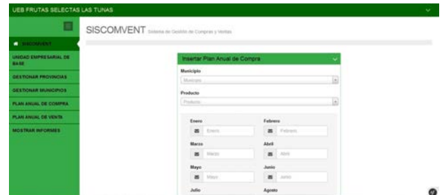
Figura 2 Formulario para crear un nuevo plan anual de compra.

En la sesión del administrador en el sistema se podrá definir los productos, las categorías y las unidades de medidas, gestionar los usuarios (Fig. 6) y verificar las trazas.