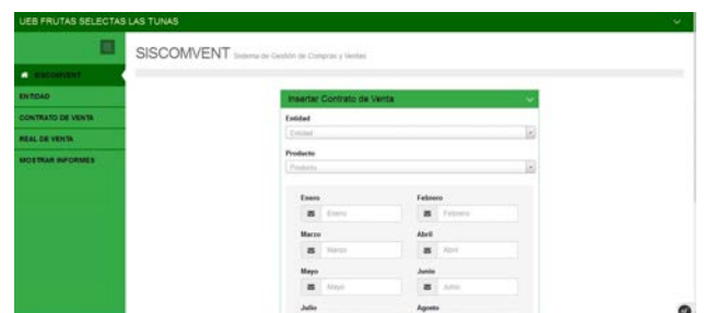
Figura 4 Formulario para confeccionar un contrato de venta.