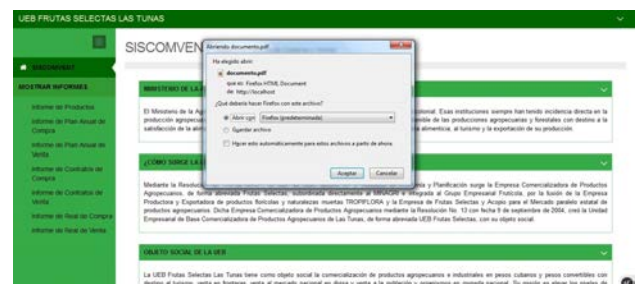
Figura 5 Vista para abrir o guardar un informe.