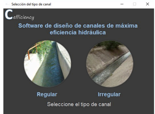
Figura 1 Pantalla principal del programa C efficiency .

El software educativo C efficiency presenta en la ventana principal dos alternativas para el diseño de canales: regular e irregular (Fig. 1). La primera alternativa, canales regulares, considera aquellos canales prismáticos cuya geometría se adapta a las condiciones de máxima eficiencia hidráulica, opción en la que se centra el desarrollo de éste artículo.