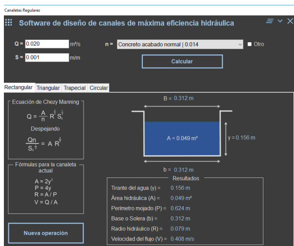
Figura 3 Ejemplo del dimensionamiento de una canal de rectangular.

información obtenida en el dimensionamiento de canales obtenida a través de la resolución de algoritmos matemáticos ejecutados en el espacio áulico sea equivalente a los datos vertidos por el software. Este hecho contribuye a la significatividad y el logro de los aprendizajes esperados en la asignatura de hidráulica en la temática de diseño de canales de máxima eficiencia, ver Fig. 3.