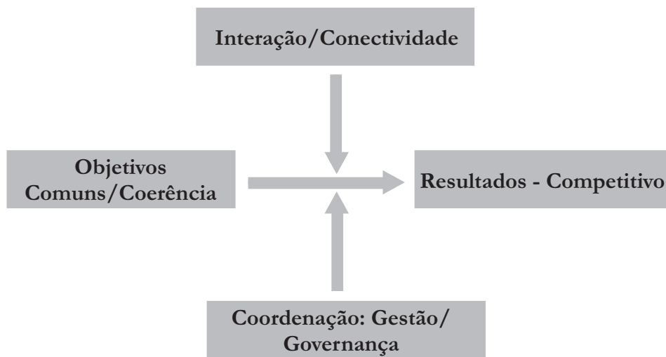
Figura 1. Condições para o estabelecimento de redes de cooperação