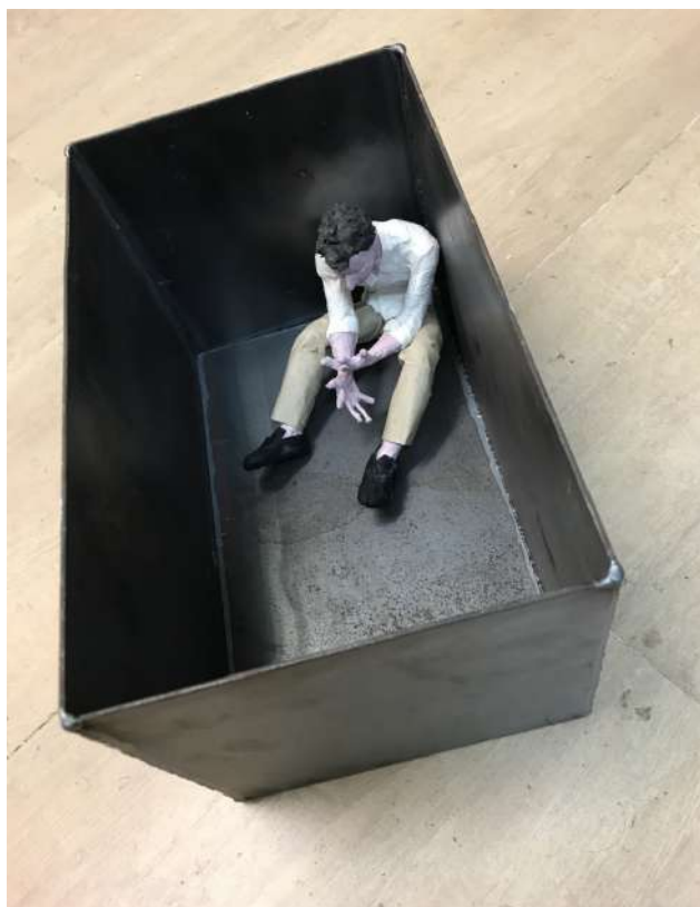
Escultura: La cárcel de Larrinaga. (Chema Lumbreras).

Tomás estuvo perseguido toda su corta vida por los poderes sociales, así que no pudo tenerlo más difícil: quince procesos –tres de ellos militares– por injurias al rey, a la religión, a las autoridades, con frecuentes internamientos en la cárcel de Larrinaga y varios exilios, algunos en el País Vasco francés, donde debe refugiarse en la casa de su amigo el pintor Gustavo de Maeztu.