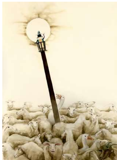
Rebaño de corderos y su obispo. (Chema Lumberas).