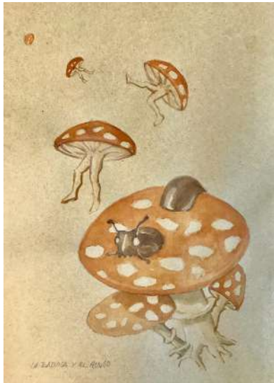
La babosa y el hongo. (Chema Lumbreras).