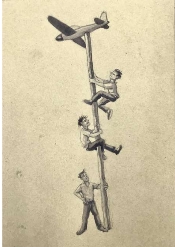
Cuestión de altura. (Chema Lumbreras).