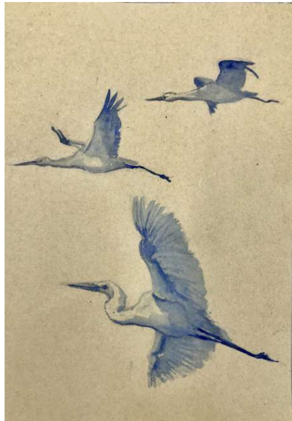
Instinto liberal. (Chema Lumbreras).