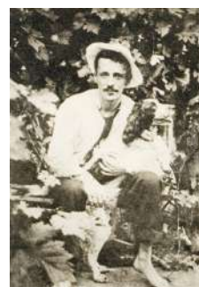
Meabe con Leo, el perro de Nemesio.

Palabras que muestran su amor por Nemesio, su gran compañero de París, y su dolor por esta muerte. Y al mismo tiempo son un ejemplo de su escritura épica ante las circunstancias de esta muerte fuera del País Vasco. No soporta esta desaparición ni esta injusticia. Desconoce que solo cinco años más tarde tendrá un fin similar. Unamuno publicó su discurso en Sensaciones de Bilbao , junto a otros varios pasajes de su vida en su tierra natal.