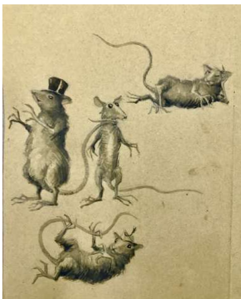
Las cuatro ratas. (Chema Lumbreras).