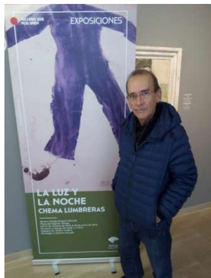
El mono azul es el emblema de las exposiciones. (Foto del autor).