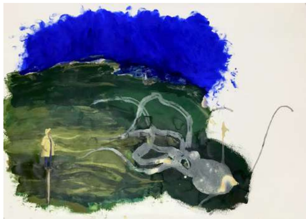
El mar.

Uno de los más asiduos colaboradores de la revista Ibérica fue Enrique Tierno Galván, que más tarde sería alcalde de Madrid, y Salvador de Madariaga fue copresidente de esta misma revista con un norteamericano.