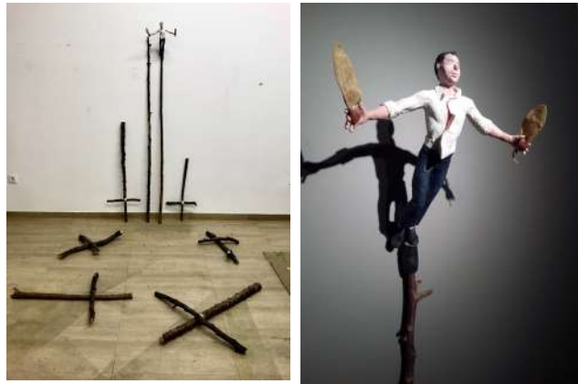
Cruces en el monte. (Chema Lumberas).

A Tomás no podía convencerle un Dios que estaba muy lejos de ser el Dios de Jesucristo, el Dios