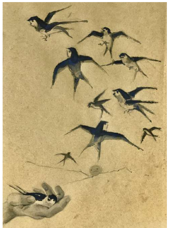
La mirada de las miradas. (Chema Lumbreras).