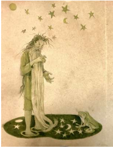
La endiosada rana. (Chema Lumbreras).