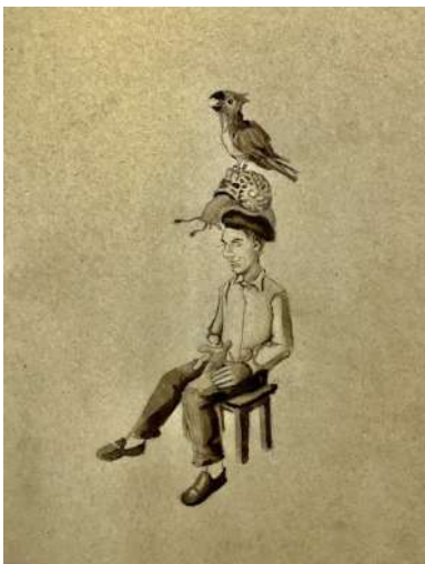
Apólogo local. (Chema Lumbreras).