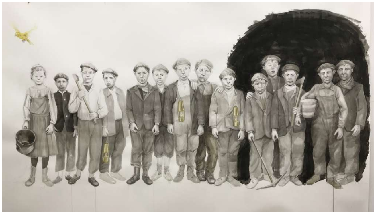
Los muchachos mineros maketos.