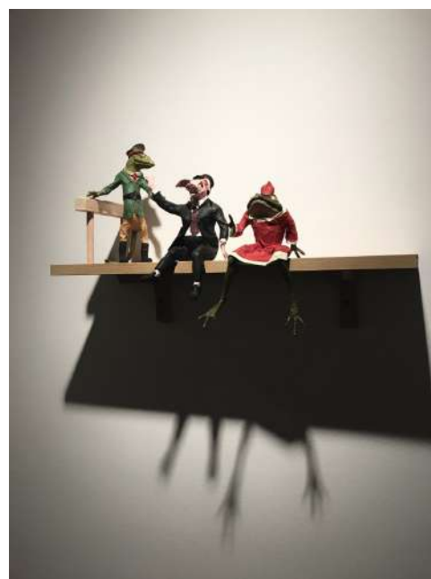
Escultura: Los tres poderes: ejército, Iglesia y capital.