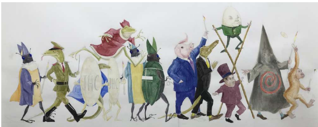
La procesión de la Virgen de Begoña.

El 12 de septiembre de 1903, en un artículo escrito en Lucha de Clases , Tomás expone su proyecto de fundar las Juventudes Socialistas. La Juventud Socialista de Bilbao se fundó el 7 de enero de 1904 y se reconocía a Tomás Meabe como fundador. Indalecio Prieto y José Madinabeitia formaron parte del Comité. En esa fecha Tomás Meabe estaba en la cárcel de Larrinaga.