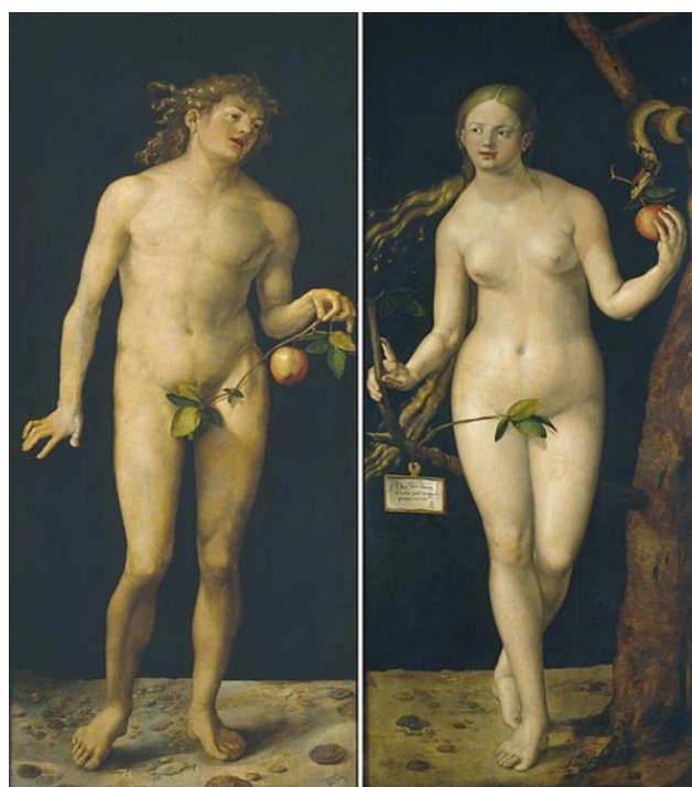
Figura 1. Adán y Eva (1507), Alberto Durero. Óleo sobre tabla. Museo del Prado.

Sin embargo, para auxilio en la creación de sus figuras, nuestro escritor también contaba con las lecciones expuestas por Eugenio d'Ors en sus Tres horas en el Museo del Prado 8 , publicada en 1923 de manera unitaria, si bien ya había visto la luz en las páginas de diversos periódicos de Cataluña. Esta obra era bien conocida por Mujica Lainez y a ella nos remite a través de las palabras de su duque en Bomarzo :