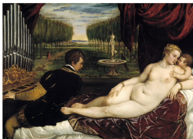
Figura 11. Venus recreándose con el amor y la música, Tiziano.

Este método mnemónico establecía que las imágenes , una vez seleccionadas, debían ser ubicadas en sus loci , esto es, espacios arquitectónicos concretos como arcos, pasillos, etcétera, y de este modo procede Manuel Mujica cuando, tras la com-