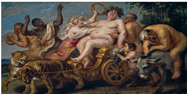
Figura 4. El triunfo de Baco, Cornelis de Vos. Óleo sobre lienzo. Museo del Prado.

En «El llanto y los remedios», la pintura de Paolo Veronese procedente del lienzo Moisés salvado de las aguas (1580), de la escuela veneciana (véase fig. 5), presta sus perfiles a la imagen de la dama, quien se proyecta especularmente en «una gran señora veneciana, vestida y ataviada con soberbio lujo», desprendida de su lienzo para salvar del llanto a una copia de la falsa Gioconda que cuelga en el Prado, lejos de la auténtica expuesta en el Museo del Louvre de París 16 . La escena cortesana dibujada por el pintor