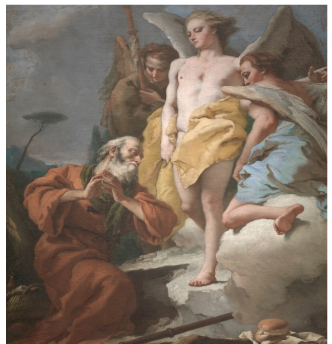
Figura 8. Abraham y los tres ángeles, Tiépolo . Óleo sobre lienzo. Museo del Prado.

«Elegancia» y «La Bella Durmiente» deben ser analizados con mayor detenimiento al ofrecer claves de primer orden que avalan la creación de emblemas en acción, la particular técnica constructiva que bebe en las fuentes del «arte de la memoria» en cuanto a la disposición arquitectónica de las imágenes portadoras de un contenido cifrado, siguiendo un diseño hermético. En las salas del palacio de Juan de Villanueva, los melancólicos moradores eternos, enfermos cortesanos, herederos de la enfermedad de sus creadores, han de buscar distracciones que curen su alma y para ello organizan una representación teatral de La Bella Durmiente en el cuento homónimo y un literario concurso de belleza, que ha de ser juzgado por los enanos y bufones desprendidos de los lienzos de Velázquez, así como por las esculturas que representan a distintas divinidades expuestas en el Prado.