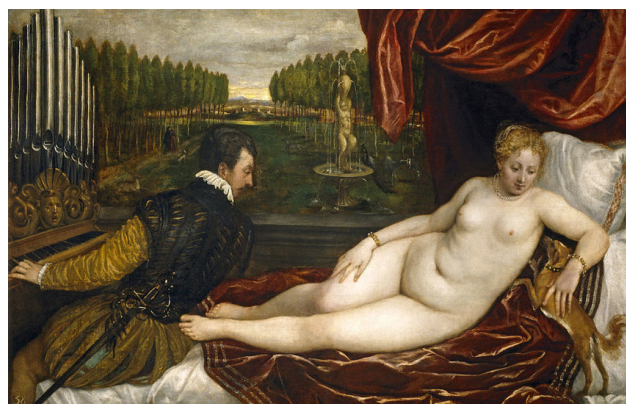
Figura 10. Venus con la música, Tiziano.

En el retrato de Van Dyck contemplamos la figura de Sir Endimion Porter, elegantemente ataviado de un rico ropaje blanco, con reflejos «de un pálido, acuático verde», en posición frontal, y a su lado emerge la figura del artista, vestido con unos ropajes negros, al igual que el cromatismo seleccionado por el maestro Tiziano para su Autorretrato , que acabaríamos de ver desfilar en el concurso de