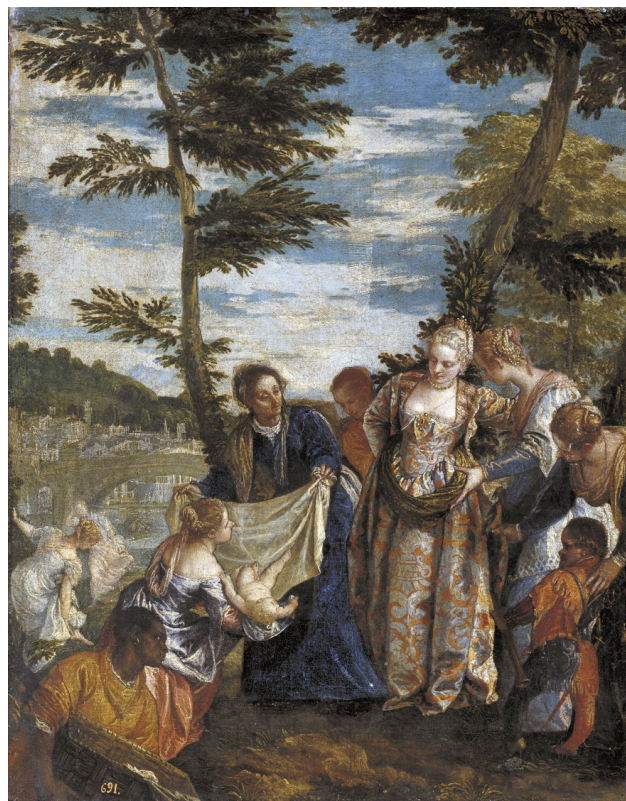
Figura 5. Moisés salvado de las aguas, Paolo Veronese. Óleo sobre lienzo. Museo del Prado.

veneciano pide ayuda en el cuento de Mujica Lainez a la pintura del Greco y de Lucia Anguissola, concretamente a los lienzos Retrato de un médico (1582-1585) y Pietro Manna, médico de Cremona (1557), para dar perfil a los dos galenos de Mujica Lainez. Las creaciones de Rafael Sanzio, concretamente la conocida como El cardenal o Retrato de un cardenal (1510) y retrato del Federico Gonzaga, I duque de Mantua (1529) de Tiziano, auxilian la imaginación del escritor argentino en la segunda línea de personajes. Como podemos ver, la sala de pintura italiana del siglo XVI ha servido de inspiración para la creación de una nueva fabulación alegórica en la que una aristocrática y caritativa dama de beneficencia, al escuchar los gemidos de una muchacha, decide buscar a dos médicos, quienes certifican que se encuentra enferma de tristeza cuando afirman que «se trata de un caso de hipocondría» 17 y proceden a discutir soluciones para su curación, ante la mirada de un miembro del clero y de la corte: