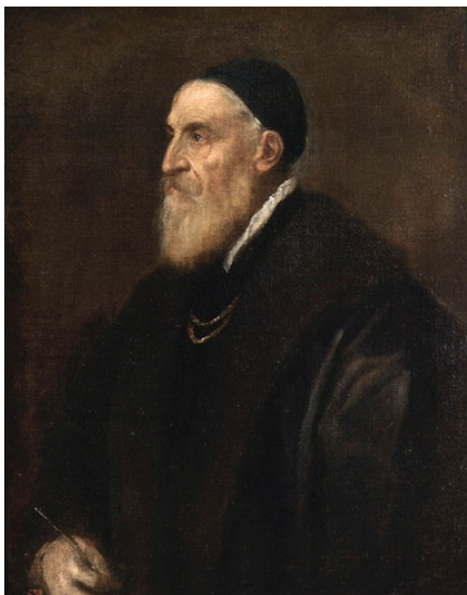
Figura 9. Autorretrato, Tiziano. Óleo sobre lienzo. Museo del Prado.

En «Elegancia», ubicadas las figuras del público a ambos lados de la galería central, a modo de palcos de un teatro, el público asiste entusiasmado al desfile de las distintas escuelas de pintura que han abandonado sus espacios habituales para acudir al evento. Desfila en primer lugar la pintura veneciana proveniente de los lienzos de Tiziano, el artista abre la comitiva mirando al público desde su Autorretrato (véase fig. 9); a continuación asoma la pintura flamenca en las formas de Van Dyck, Antonio Moro, desde Utrecht, Frans Pourbus y Rubens, desde Amberes y la ciudad anteriormente mencionada; Hans Memling desde Brujas, el Parmigianino de Parma, para cerrar con la pintura francesa y las criaturas de las salas de pintura española, provenientes de los lienzos del Greco, Sánchez Coello, Pantoja de la Cruz, Goya y Velázquez. El literario galardón habrá de ser otorgado al Renacimiento alemán, a las tablas que Durero pintó en 1507, Adán y Eva , como ya dijimos anteriormente, en una significación muy precisa que nos conduce a uno de los vértices del diseño alegórico: la aristocracia del artista que se glorifica como un temperamento superior, dominado por la melancolía propia del genio creador que plasma su contemplación de la Belleza en sus creaciones, llevando a Mujica Lainez a transitar de nuevo el recorrido de Eugenio d'Ors, en un movimiento manierista.