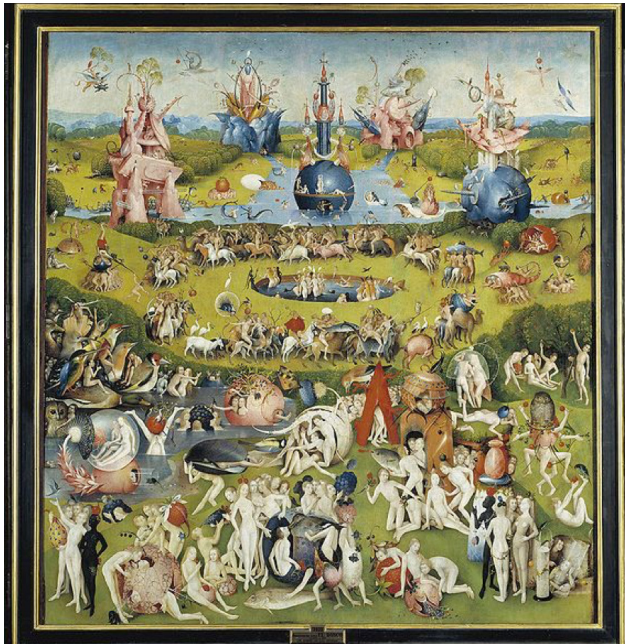
Figura 7. El jardín de las delicias (panel central), El Bosco . Óleo sobre tabla. Museo del Prado.

frailes del Museo. El cuadro parece obra del Diabolo por imaginativo y por tentador. Empero, es la obra de un místico de admirable refinamiento, en quien convergen las ideas de los iluminados y de los alquimistas medioevales. Jheronimus Bosch tendió al hombre, en su Carro de Heno, el espejo de la Codicia; en el Jardín, le tiende el de la Lujuria. (Mujica Lainez, Un novelista : 95)