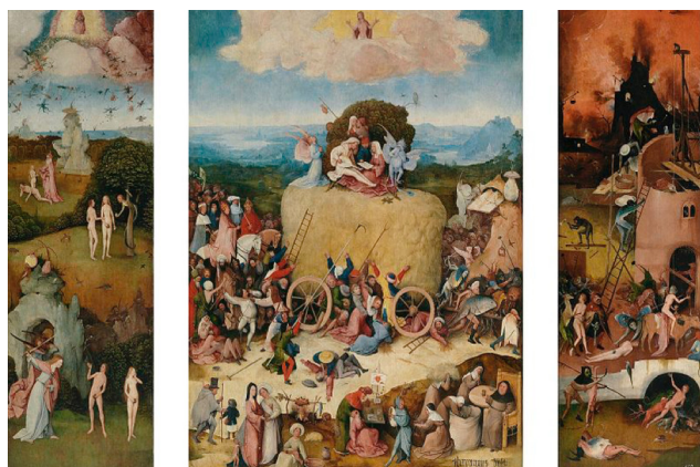
Figura 3. El carro de heno (1500-1502), El Bosco. Óleo sobre tabla. Museo del Prado.

nico originario de Grecia que es conocido gracias a las fuentes latinas y, desde ahí, atraviesa toda la Edad Media al servicio de una didáctica moralizante hasta llegar al Renacimiento, uno de sus momentos de mayor esplendor, asociado al hermetismo y al ocultismo 12 . El Arte se convierte así en un tesoro que guarda celosamente los contenidos que la Edad Media quiso recordar y este sentido ocultista preserva el método hasta el Renacimiento, constituyéndose en un vehículo idóneo para esconder los secretos del círculo neoplatónico de Marsilio Ficino, con figuras vinculadas al hermetismo como Pierio Valeriano, ámbito conocido por el narrador argentino y que emerge en el capítulo «Incertidumbres del amor», dando forma al destierro florentino del duque en Bomarzo :