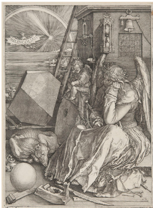
Figura 2. Melancolía I (1517), Alberto Durero. Grabado. Biblioteca Nacional de París.

He tropezado no recuerdo dónde con una frase de Eugenio d'Ors quien, refiriéndose al Renacimiento, declara que fue un tiempo de neta vocación aristocrática, y señala que cualquier artesano, orfebre, forjador o imprentero, no descansaba hasta obtener, de las autoridades de su gremio, certificados de nobleza. (Mujica Lainez, Bomarzo : 26).