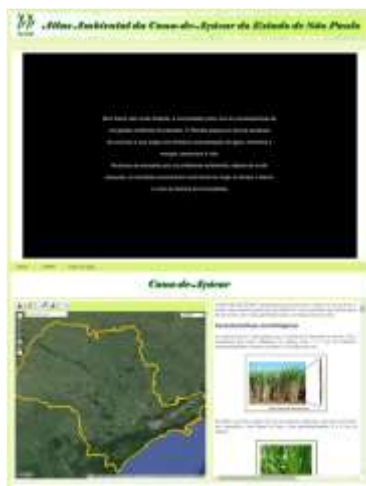
FIGURA 2 – Leiaute da página com o jogo para o protótipo do Atlas.

jogo (Jogo) ou sem jogo (Atlas), para atender tanto ao interesse do aluno quanto ao do educador que pode trabalhar com o atlas sem ter que acessar o jogo. A página com o jogo buscou atrair o interesse do jovem e lhe proporcionar estrutura para a construção de seu saber (aprendizagem). Ela está dividida em três partes e dá ênfase ao jogo (Figura 2).