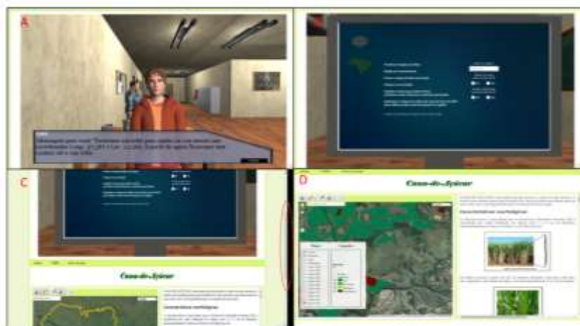
FIGURA 4 – Visualização das janelas do jogo e do SIG e do texto que compõem o Atlas.

O desenvolvimento de atlas com o uso de jogos eletrônicos como recurso educacional coloca o aluno (jogador) como responsável pela sua aprendizagem e permite criar ambientes que simulem a realidade em que estão inseridos de forma lúdica, estimulando o reconhecimento dos problemas do mundo atual e também intervir e promover as transformações necessárias. Estas possibilidades salientam os jogos eletrônicos e, por consequência o atlas, como um recurso educacional em consonância com diretrizes educacionais como a metodologia ativa e a pedagogia da problematização abordada por Freire (1983; 1996) e Dewey (1997), entre outras referências.