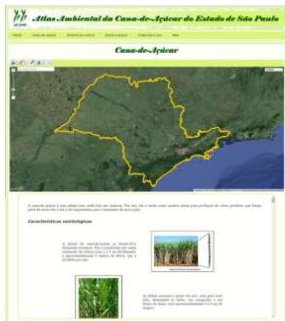
FIGURA 3 – Leiaute da página sem o jogo.

De forma geral a plataforma do protótipo foi criada em três camadas, sendo o Python para o gerenciamento das páginas, HTML e CSS para a edição de texto e design, finalmente o JavaScript para a construção do SIG. Essa é outra característica bastante interessante deste framework , pois poder fazer uso de várias linguagens de programação permite construir o atlas em etapas diferentes e separadas, permitindo o envolvimento de vários profissionais de diferentes áreas do conhecimento. Por exemplo, um educador que mesmo sem conhecer linguagem de programação pode gerar o conteúdo do atlas na forma de texto, tabelas, figuras e vídeos, usando um editor de texto de alto nível 8 e salvando em formato de arquivo HTML, para depois ser inserido na plataforma do atlas pelo programador. Desta maneira, fica garantida a inserção dos conteúdos programáticos escolares na temática abordada pelo atlas e a busca de ir além da transmissão de informação, realçando a relação sujeito/objeto, proporcionando um ambiente para a construção do conhecimento, como nos ensina Pino (2001) e Freire (1983 e 1996). É importante contar com a ajuda de um profissional da educação, para fazer a adequação desse conteúdo, pois, como ressaltado por Almeida (2003), se o problema do cartógrafo é mapear o local, o do professor é ensinar o local, considerando as necessidades da comunidade escolar e o currículo escolar.