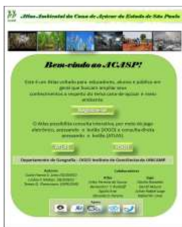
FIGURA 1 – Página de abertura do protótipo do Atlas.

A plataforma criada, possui três janelas principais, a primeira janela ( home ) (Figura 1) é a entrada para o Atlas e apresenta além das informações referentes aos autores e colaboradores, três botões que são: Registrar-se, Atlas e Jogo.