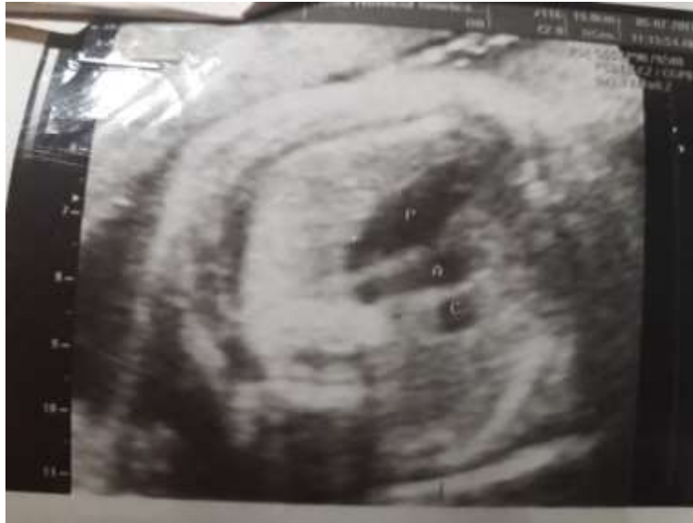
Figura 2. Imagen prenatal donde se observa cardiomegalia, por la relación aorto-cava se plantea isomerismo izquierdo, estenosis valvular aórtica.

Resultado de la biopsia de cuello uterino (en la madre del propósito): carcinoma epidermoide in situ de células grandes no queratizante por Virus del Papiloma Humano con marcada atipia coilocítica.