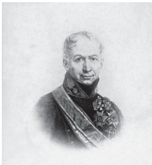
Fig. 1. Litografía de Joaquín de Osma Tricio extraída de un retrato al óleo de Vicente López. (Álbum familiar). Archivo Osma. IER. Logroño.

general de La Romana durante la guerra de la Independencia. En 1815 ascendió a brigadier, y por su brillante hoja de servicios al cabo de dos años era nombrado jefe de Artillería de la plaza de San Sebastián con el grado de coronel, culminando su fulgurante carrera en la comandancia general del Cuerpo con el empleo de mariscal de campo. Al estallar la guerra carlista, considerando el gobierno que, como riojano, era buen conocedor del terreno, asumió con el general Espoz y Mina la comandancia del Ejército del Norte [Vid. fig. 1].