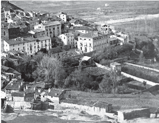
Fig. 4. Vista parcial de Nalda (c. 1920). A la derecha Plaza de la Tela, la Csa Grande y huerta de Viñapalacio.