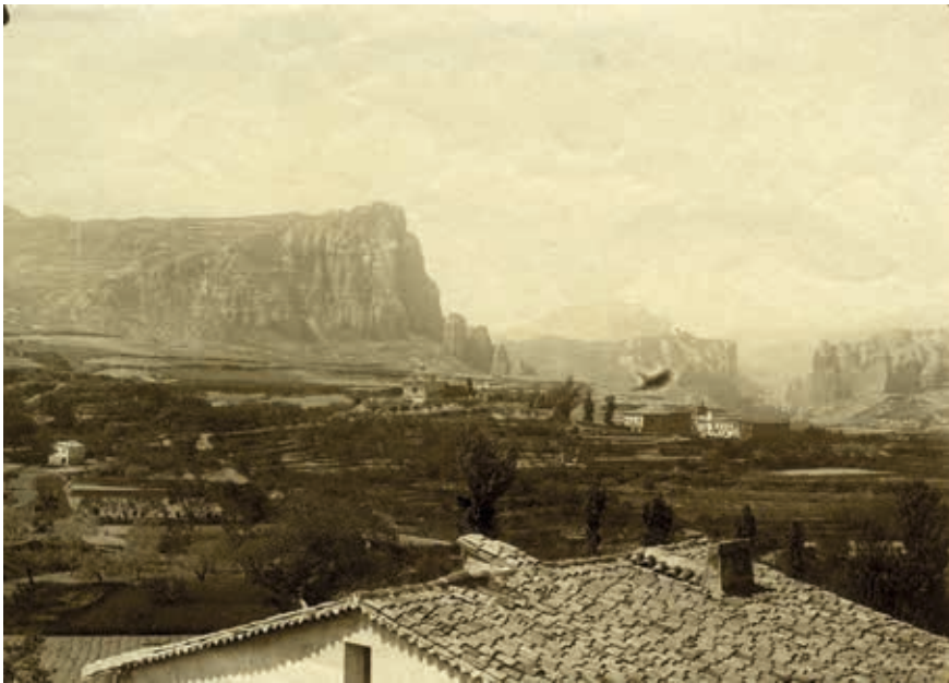
Fig. 7. Vista de la ermita de Nª Sra. de Villavieja y del panteón y convento de San antonio. A la izda. término de “La Decara” (c. 1920).