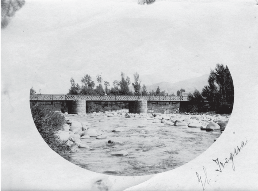
Fig. 8. Puente de Hierro sobre el río Iregua (c. 1900).

Y en efecto, el día 15 de marzo de 1881, finalizadas las obras y superadas las pruebas de resistencia, a las seis de la tarde bajaron en procesión hasta el río autoridades, cofradías y vecindario con pendones y estandartes portando la imagen de San Gregorio Ostiense, protector de los campos. Y entre volteo y repique de campanas se procedió a la bendición del nuevo puente, agradeciendo el alcalde a los bienhechores su generosidad con estallido de cohetes y vítores a la memoria de su progenitor, coreados por una entusiasta multitud 61 . [Vid. anexo 3, documento]