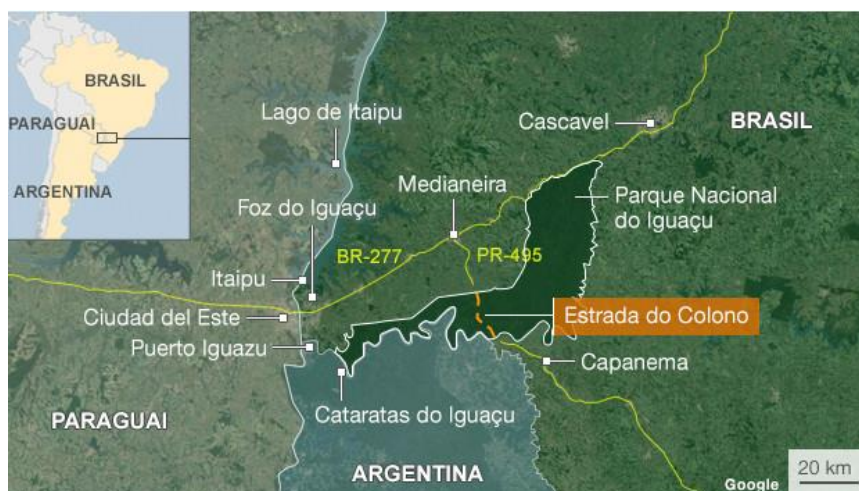
Figura 4 – Localização da estrada do Colono