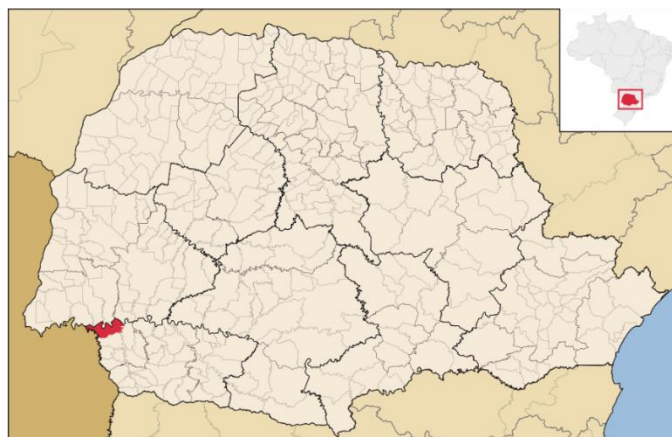
Figura 1 – Localização do município de Capanema