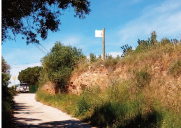
Cartell indicador a la Creu de Salom del camí de Reus estant, el cotxe és al camí d'Almoster.

mas de N'Oliva al terme de Constantí, que havia obtingut per deutes del seu propietari. El preu fou de 25 quartans d'oli. 7 Aquesta és l'única dada a on es fa menció expressa de jueus concrets relacionats amb Constantí, tot i què realment residien a Tarragona. 8