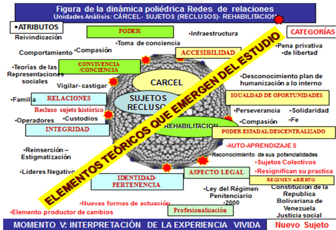
Gráfico. Interpretación de la relación de categorías

análisis social la cual entiende a los sujetos colectivos como emergente por la toma de conciencia de sus condiciones materiales y simbólicas de existencia, que actúa en la representación como elemento productor del cambio generando un comportamiento de sujeto histórico transformador. Existen distintas teorías sobre el papel y el proceso de construcción del sujeto social y político, llámese pueblo, clase o nación. Hay que partir de la experiencia y el comportamiento social sobre la base de intereses compartidos, demandas colectivas, relaciones sociales y expresión cultural. Estos aspectos son claves para la formación de las clases o el pueblo en cuanto sujeto colectivo, como pertenencia o identidad y práctica social, o sea los agentes o sujetos de cambio. No hay que quedarse en la clase objetiva (en sí), considerando que la conciencia puede venir por añadidura, y desde ahí construir un nuevo sujeto.