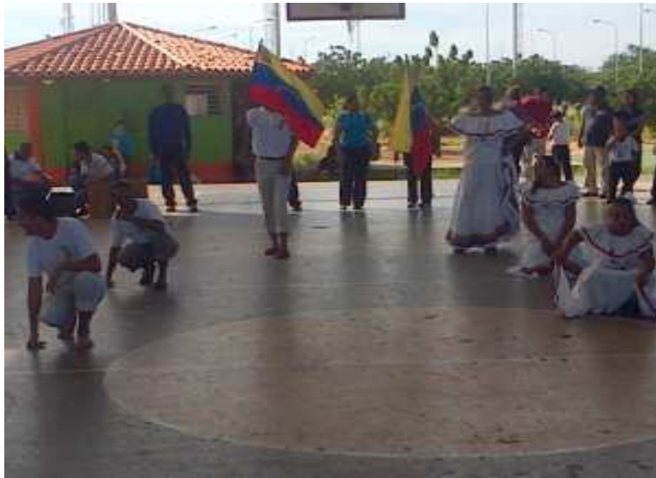
Figura 4. Niños y niñas con autismo y síndrome de Dawn, compartiendo un baile folklórico junto a sus docentes.

Integrándose la triada, alumnos-docentes-padres y representantes para así lograr la participación de todos tomando en cuenta las posibilidades y la inclusión, en la que los alumnos mostraron sus cualidades mediante los bailes en la cual los niños y niñas oyentes fueron los guías para los de discapacidad Auditiva, discapacidad intelectual (autismo), y Dawn, congeniando ritmos.