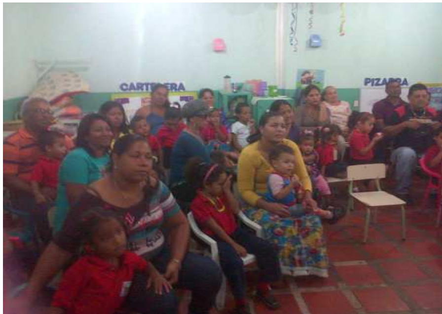
Figura 6. Niños, niñas, docentes padres y representantes apoyando con su presencia en socializaciones sobre discapacidad.