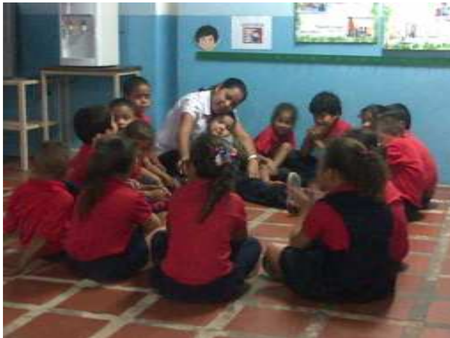
Figura 7. Participación de la docente con niños y niñas con discapacidad auditiva, mediante cantos tradicionales.

Los padres por su parte mostraron muchas inquietudes con respecto a la inclusión de los niños y niñas con discapacidad con sus hijos, en la cual se les brindo orientaciones, calmando un poco su angustia e interrogantes, haciendo comparaciones entre el embarazo de cada uno de los presente y la llegada del bebe a la casa. Pudiendo ellos llegar a sus propias conclusiones que tenían muchas similitudes, como: el tiempo de gestación, los síntomas, la ansiedad del genero, la compra de artículos, la llegada (parto normal o cesárea) la primera noche en casa, en fin el amor y la angustia del llanto, para llegar a la conclusión que lo más importante es el amor. Así mismo, muchos procesos emocionales se pudo observar, entre llantos y alegrías se apoyaron unas a las otras en este duro pero hermosa encomienda