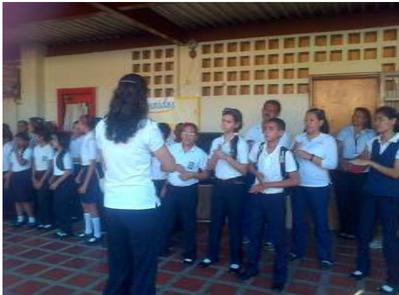
Figura 2. Niños y niñas con discapacidad auditiva compartiendo espacios de aprendizajes y cantos tradicionales

En la Comunión del Conocimiento Se pudo constatar que mediante la técnica de la observación que al principio cada uno de los niños y niñas oyentes de la institución realizaban señas para comunicarse con los no oyentes, pero que poco a poco fueron adaptándose a las herramientas pedagógicas que se habían planificado para tal fin y que al culminar la jornada todo fue un gran éxito. En estas circunstancias, el rol del docente demanda de una serie de atributos que son necesarios para una praxis educativa de calidad, entre las que destaca el profesionalismo, la cual está basada en una formación científica y humanística, que ha de ayudar a todos estos niños y niñas quienes presentan una condición especial, así como también, el comprometerse mediante una actitud social e institucional, para ser capaces de diseñar, planificar y aplicar acciones que ayuden a solventar o aligerar las diferentes situaciones que se puedan presentar surgidas por la condición que presenten algunos de los estudiantes