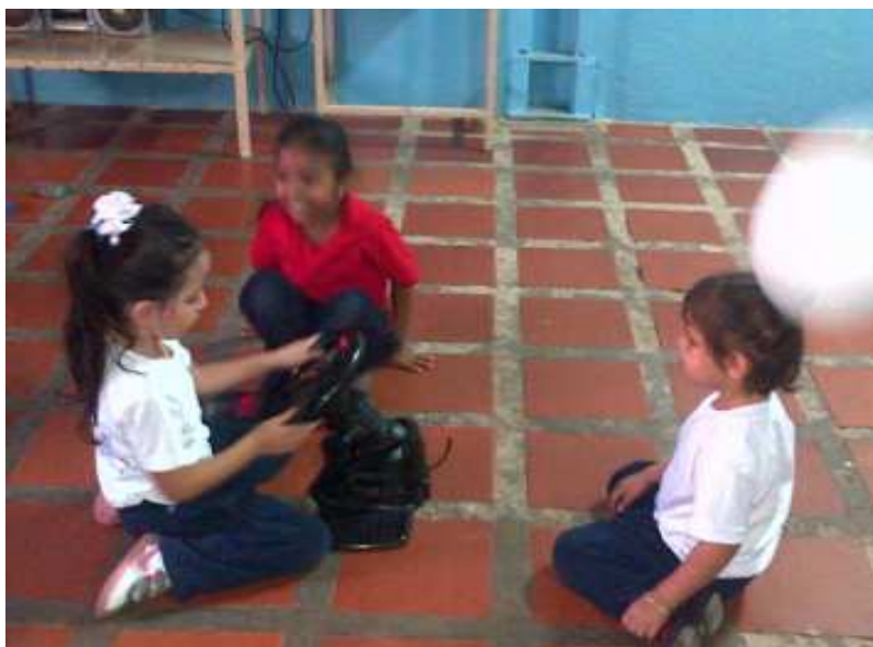
Figura 1. Niños y niñas con discapacidad auditiva compartiendo actividades recreativas

Cabe destacar que las técnicas utilizadas en el estudio en cuestión, se encuentran la observación directa, la entrevista no estructurada y la encuesta, para lo que se utilizaron como instrumentos el guión de entrevista, el cuaderno de anotaciones y el registro diario de acciones, lo que sirvieron para recolectar toda la información necesaria para el desarrollo de la investigación.