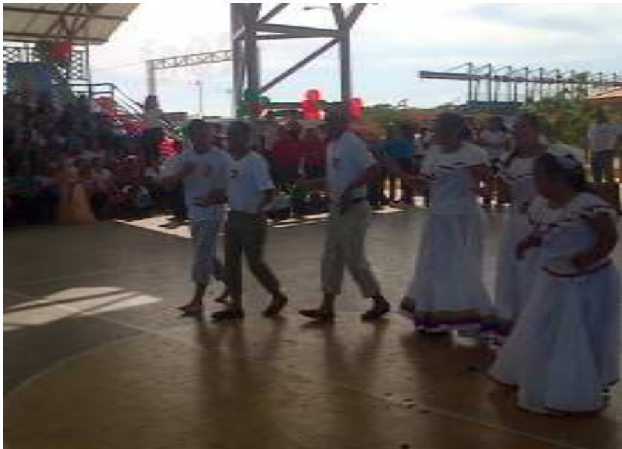
Figura 3. Niños y niñas con síndrome de Dawn y autismo compartiendo un baile folklórico

educación para la inclusión, concebida como educación para toda la vida, debería ser accesible especialmente para los grupos; se destaca la importancia de que este proceso, continuo y gradual, se inicie tempranamente y se pueda articular a lo largo de los diferentes niveles de enseñanza.