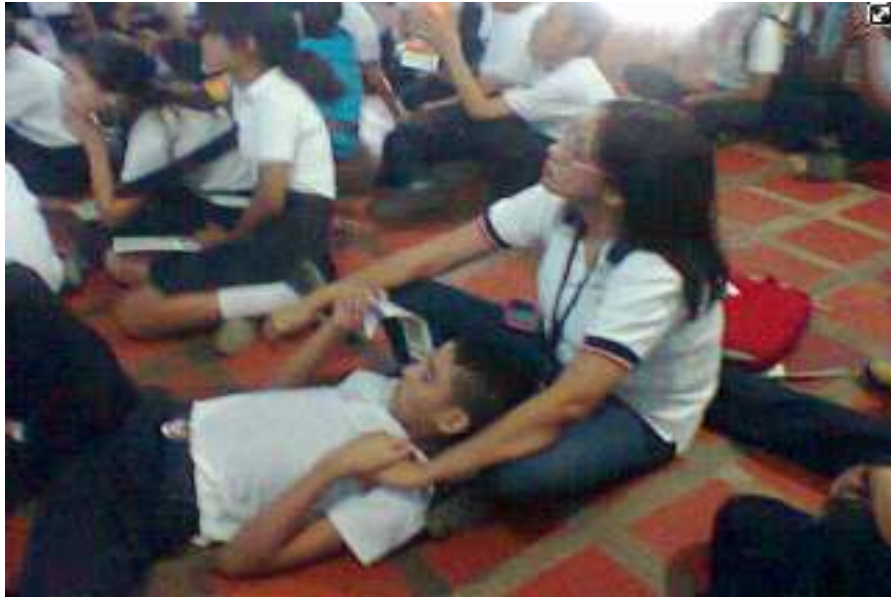
Figura 5. Padres y representantes compartiendo una socialización sobre discapacidad