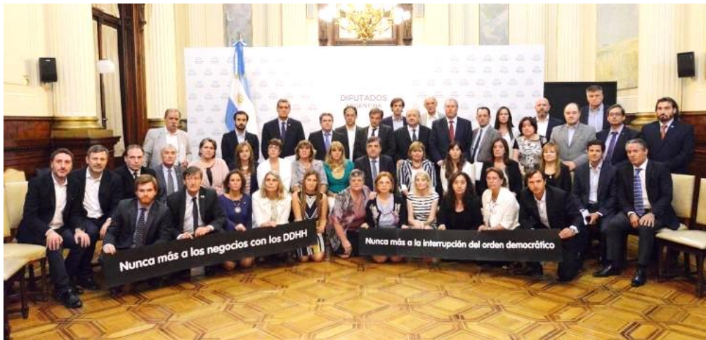
Imagen N° 3. Diputadas y diputados argentinos de la alianza oficialista Cambiemos. Día de la memoria. 24 de marzo de 2017.