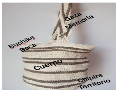
La Matriz TerritorioCuerpoMemoria y el Tejido de la mochila Kankuama 24