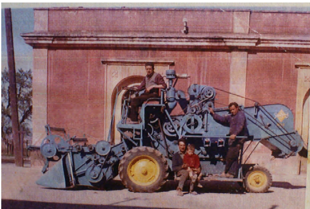
Màquina de segar i batre, la primera de la Conca de Barberà