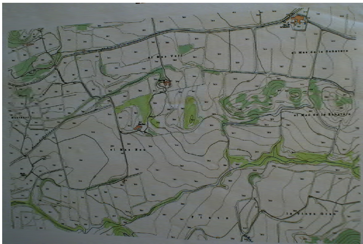
Mapa de les finques del Mas Nou