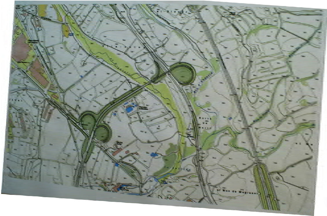
Mapa de l'Horta de la Sallida