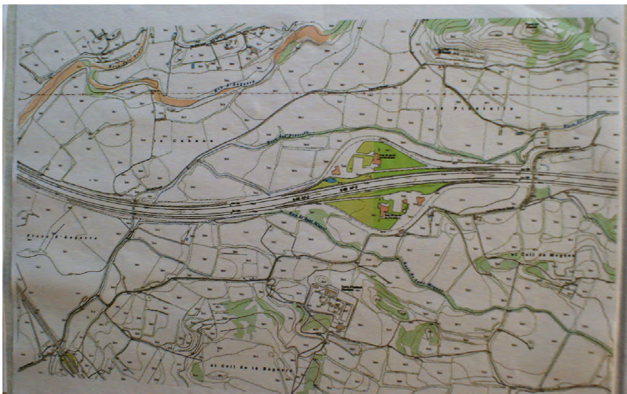
Mapa del Camí del Pinetell

-Lluís Foix, El que la Terra m'ha donat , Barcelona, 2017.