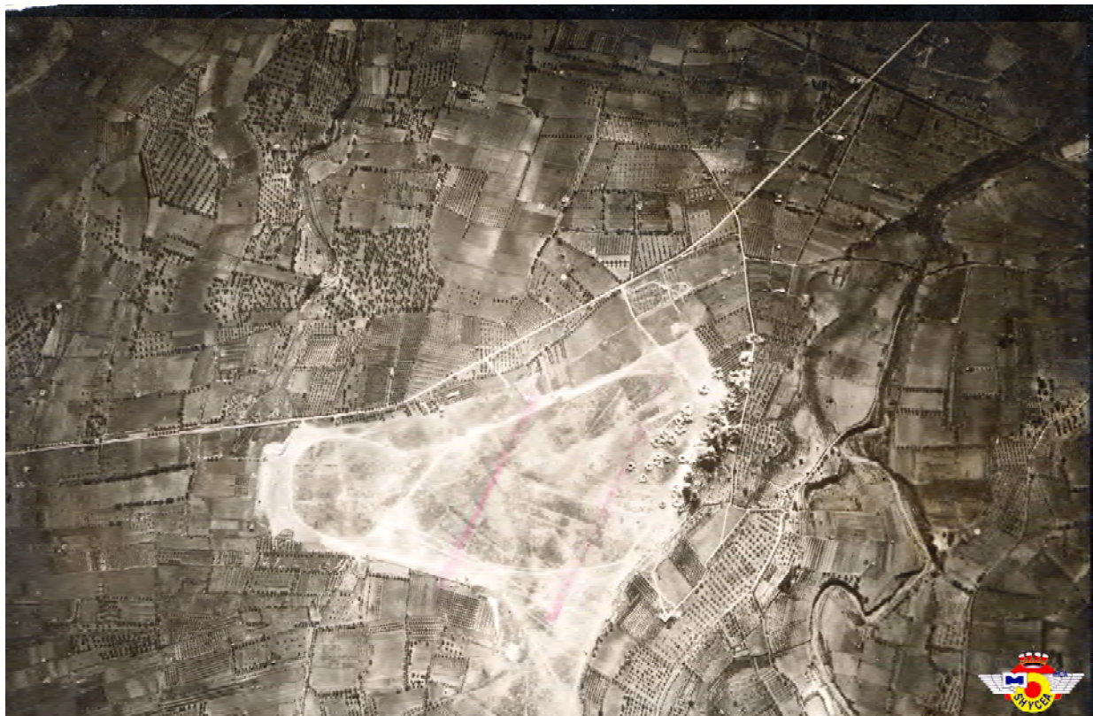
Imatge 6: Bombardeig de l'aeròdrom de Valls el 5 de novembre de 1938 en una fotografia captada per l'Aviació Legionària italiana.

Al cap d'un mes, el 5 de novembre, l'aviació feixista bombardejarà tots els aeròdroms de l'aviació de caça republicana a Catalunya, des dels quals es participava a la batalla de l'Ebre. Hi participaran una cinquantena d'aparells adscrits a la Legió Còndor alemanya, l'Aviazione Legionaria italiana i a la Brigada Hispana. A les 13,19h, s'identifiquen quinze bombarders que llencen en dues passades de bombes de 50 a 100kg contra l'aeròdrom de Valls i que provoquen la destrucció de dos caces Polikarpov I-16 Mosques , un cotxe d'incendis i una furgoneta d'aviació. Un obrer de la brigada d'obres d'aviació serà ferit greu. Els embuts de les bombes faran que l'aeròdrom resti inhàbil unes hores. En canvi, l'aeròdrom del Pla de Cabra resta sense novetat. 37 L'atac als aeròdroms de Valls i de Reus serà protagonitzat per Heinkels He-111 i Dorniers Do-17 que portaran una escorta de dotze caces Messerschmitt Bf.109. Aquesta vegada l'aviació de caça republicana s'enlairarà i quinze mosques de Reus i Valls combatran amb els Messerschmitt Bf.109, un dels quals haurà d'aterrar d'emergència per quedar ferit en combat el seu pilot, que haurà d'aterrar prop de Tortosa. 38