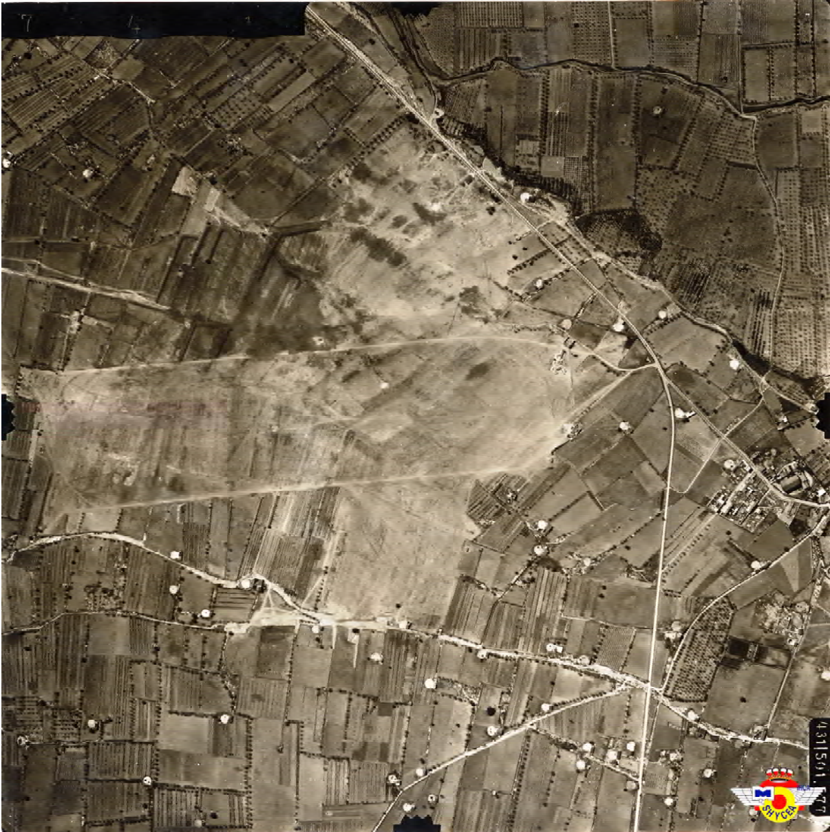
Imatge 7: Aeròdrom del Pla de Cabra amb les marques de les bombes del bombardeig del 21 de desembre de 1938 en una fotografia posterior (AHEA).

assenyala que a les 20,34h un aparell enemic llança dues bombes entre Valls i Montblanc que cauen en despoblat, sense provocar víctimes. 48