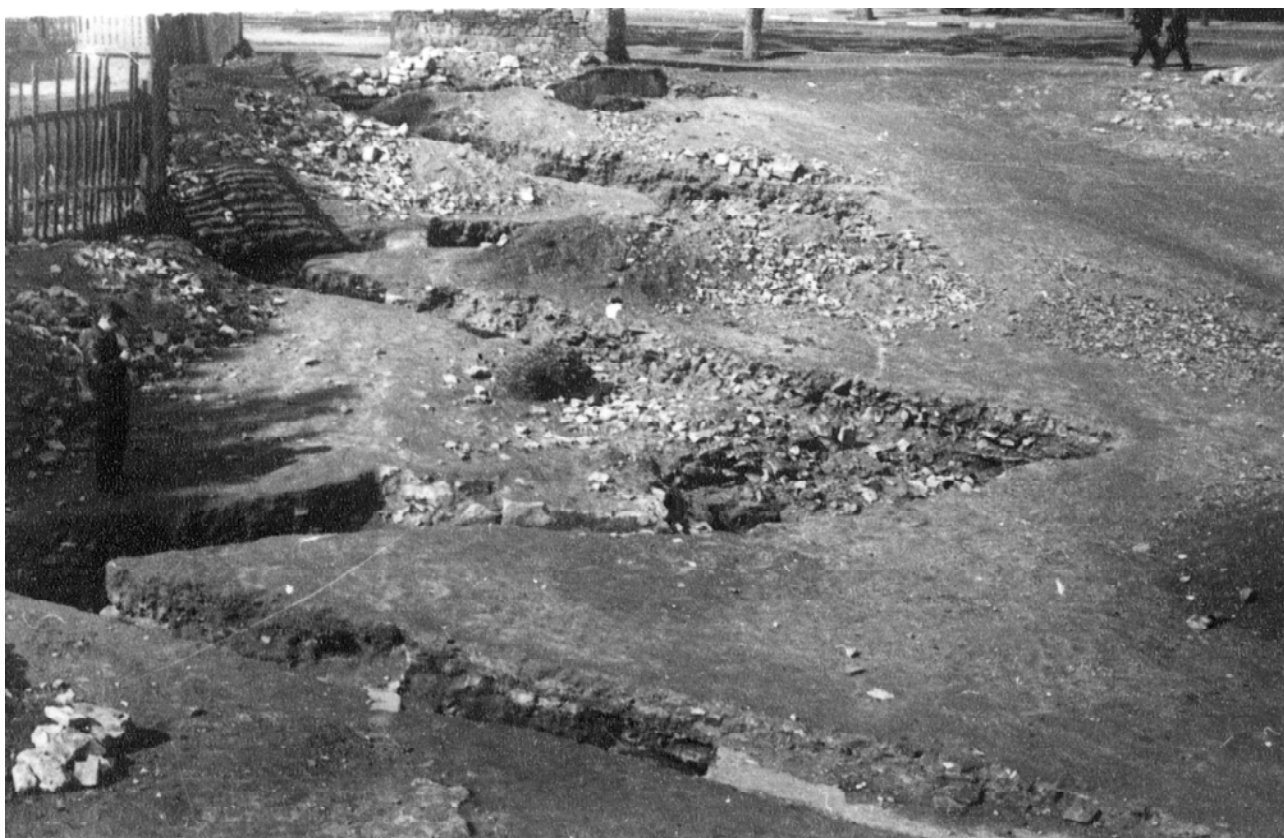
Imatge 4: refugis Valls