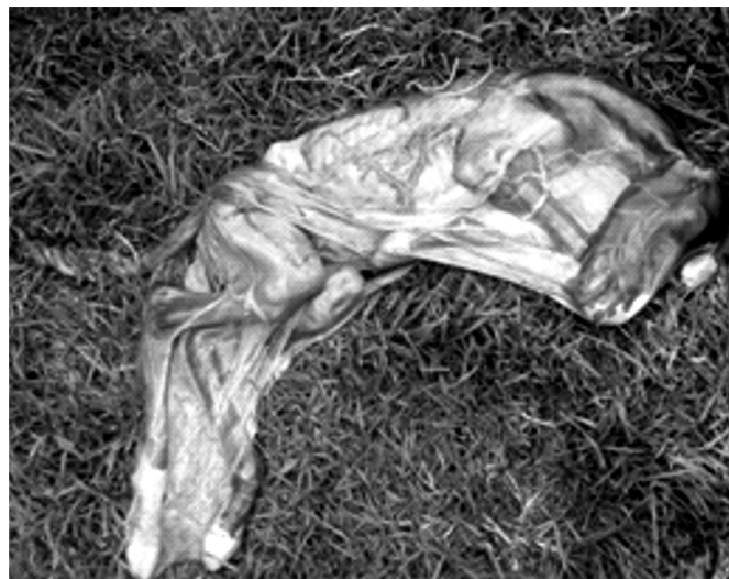
Figura 1. Potro de tamaño reducido con 9 meses de gestación con condición corporal 1.5/5, nótese el arco costal prominente.

En el examen clínico se encontró: frecuencia cardiaca 42 l/min, frecuencia respiratoria 22 r/min, temperatura rectal de 38.1°C, tiempo de llenado capilar 2 segundos y mucosas rosadas. En el sistema tegumentario se encontró aumento de tamaño de la glándula mamaria y producción de leche; signos de molestia abdominal leve y relinchos constantes. A la palpación transrectal se evidenció gestación de 220 días aproximadamente, feto activo y responsivo a estímulos de presión leve, al examen ultrasonográfico se encontró un engrosamiento de la estrella cervical (espesor 18 mm). Tanto el sistema respiratorio, digestivo, nervioso, musculo esquelético y genitourinario se encontraron sin anormalidad aparente.