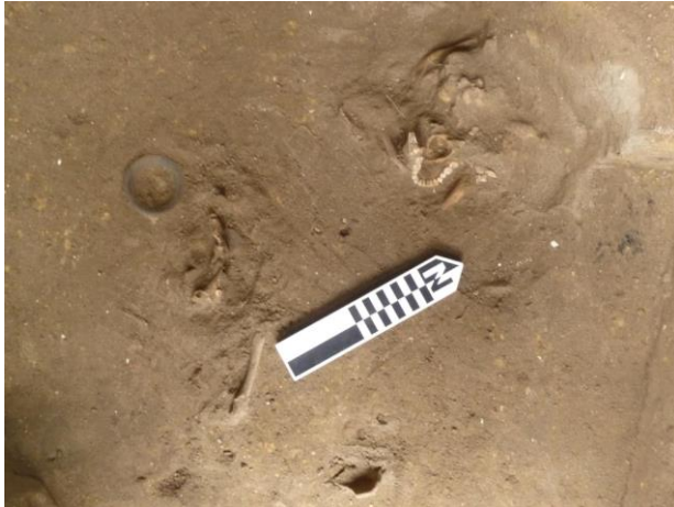
Foto 10. Entierro sentado Guangala, con la cabeza desplazada. Zanja 2.