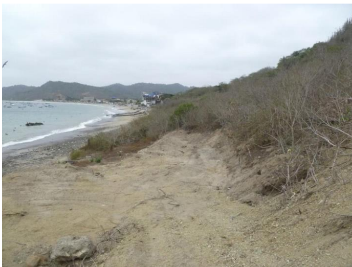
Foto 20. Las terrazas manteñas de Punto 20, 300 metros al suroeste desde la fábrica.