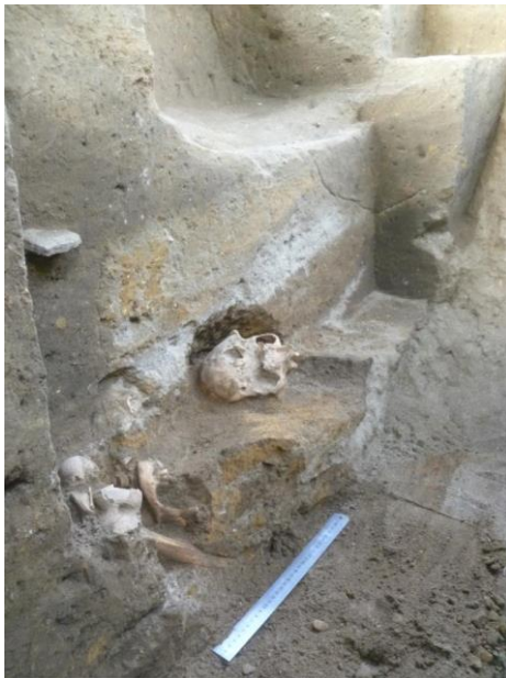
Foto 11. Una vasija cerámica aparece al sur de un entierro sentado, Zanja 2.