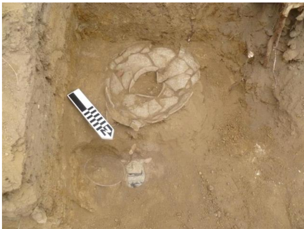
Foto 15. Entierro secundario con figurín silbato colocado por la ruta hacia el centro ceremonial.