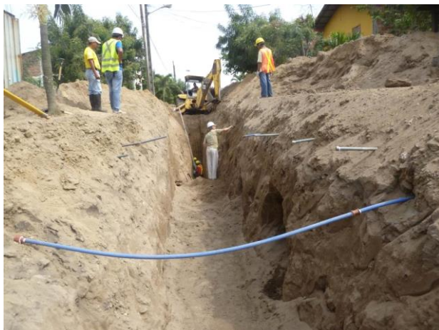
Foto 2. Limpiando el perfil de la zanja en Punto 12.