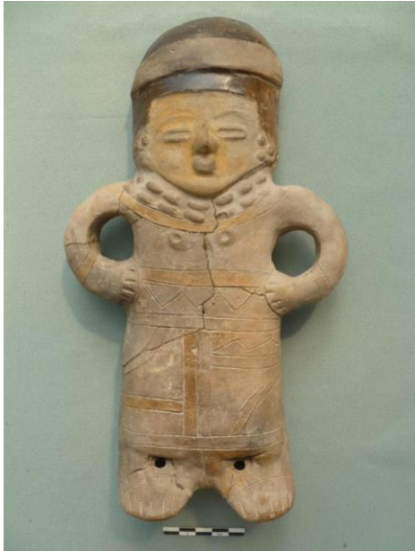
Foto 14. Figurín silbato Bahía II del entierro secundario en Calle Larga.