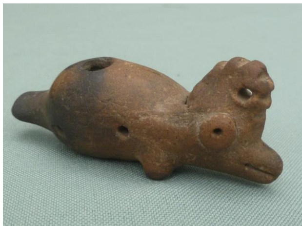
Foto 7. Ocarina-silbato asociada con el entierro fundador del montículo este, Zanja 2.