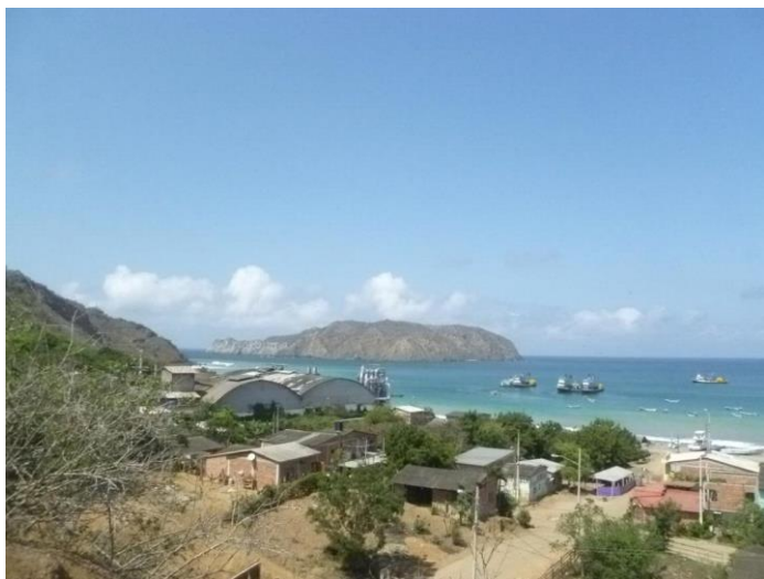
Foto 3: Barrio Las Acacias y la Isla Salango. Calle 22 se encuentra al derecho inferior.