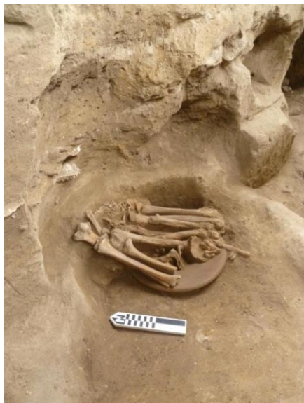
Foto 12. Un entierro primario sobre un plato con repositados huesos de otro individuo.