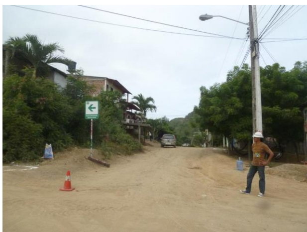
Foto 13. Calle Larga y la ruta al centro ceremonial, con Punto 18 a la izquierda.