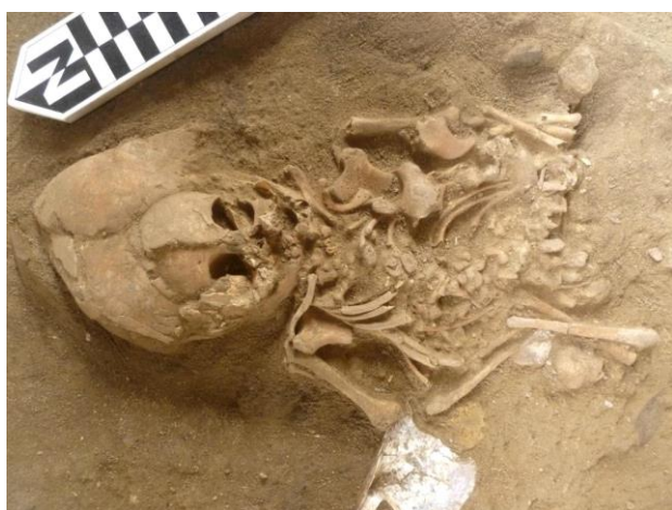
Foto 9. Entierro (disturbado) de un infante con casco-cráneo. Foto 10. Entierro sentado Guangala, con la cabeza desplazada. Zanja 2.