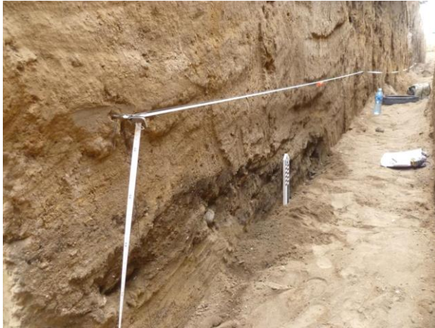
Foto 5. El basural acerámico al fondo del extremo este de Zanja 2.