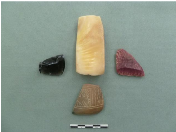
Foto 19. Seleccionados artefactos enterrados como ofrendas en la sustancia del muro inclinado.