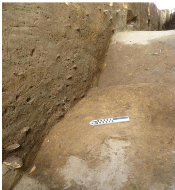
Foto 17. Muro inclinado al extremo oeste de Zanja 2, con una parcialmente excavada capa de arcilla.