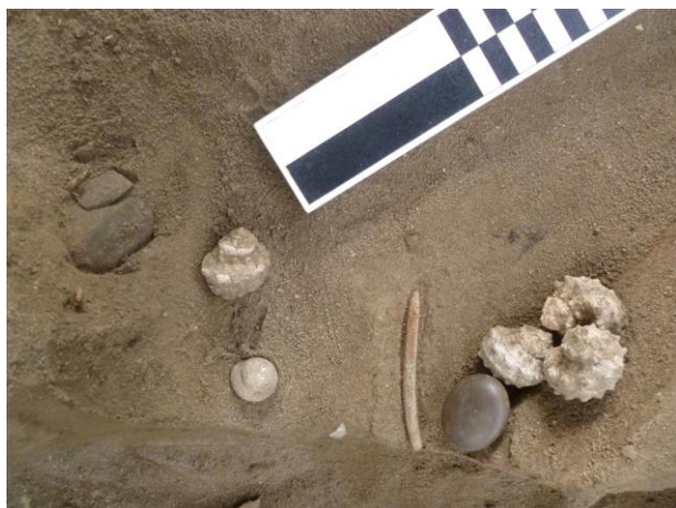
Foto 8: Conchas y otras ofrendas colocadas entre los montículos funerarios Guangala.