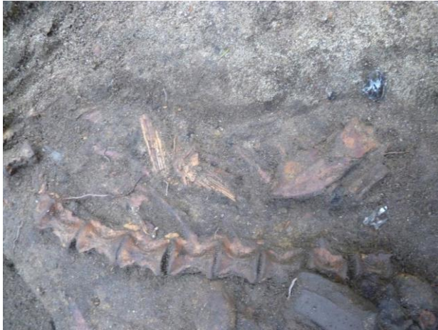
Foto 18. Huesos de pescado y dos lascas de obsidiana (derecha) enterrados dentro del muro inclinado.