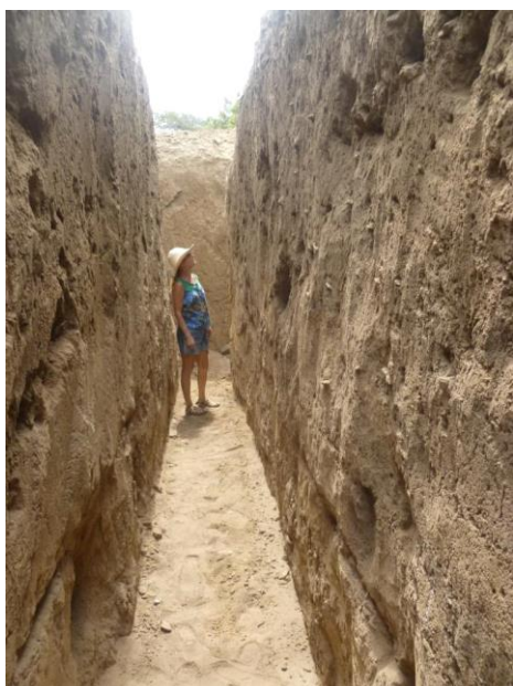
Foto 4. Zanja 1 después de limpiar sus paredes. Vista hacia al extremo este.