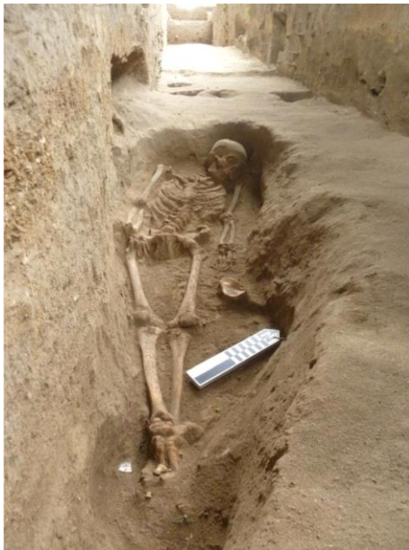
Foto 6. El entierro fundador del montículo este, fase Guangala muy temprana, Zanja 2.