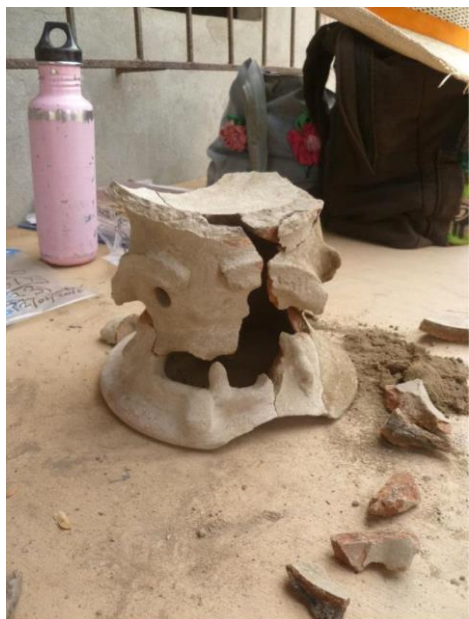
Foto 16. Cabeza de un poderoso espíritu descubierto en Zanja 3.