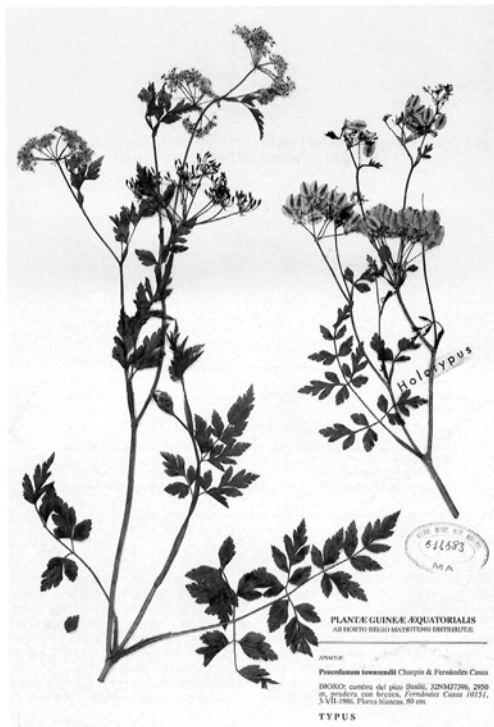
Fig. 1.— Peucedanum townsendii Charpin & Fern. Casas (Fernández Casas 10151, MA 511583, holótipo a la derecha).