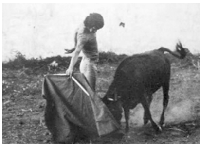
Fig. n.º 23.- Camarón de la Isla toreando una vaquilla en el campo, posiblemente en los años 60. Se lee en internet que esta foto podía ser comentada en la antigua web de José Tomás. Apud. http://losfardos.blogspot.com . No ha sido posible identificar al autor de la fotografía.

El vídeo en Youtube está acompañado de un interesante texto del propio Pachón en el que reflexiona sobre la relación