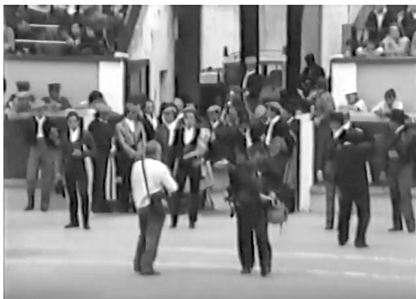
Fig. n.º 25.- Los toreros preparados para iniciar el paseillo en la plaza de toros de Badajoz el 29 de octubre de 1988.

extraordinario de los últimos años. Como se observa en el vídeo, los cantaores estaba en las primeras filas del tendido, como si fuera la barrera, justo detrás de la parte del callejón de los toreros. Detrás de Camarón , durante los momentos previos a la corrida, –ese es uno de los principales recuerdos–, un grupo grande de gitanas animaban tocando las palmas por bulerías, cantando y, quizás alguna, improvisando un baile. Quizás alguna también tenía una melena roja como la de Camarón .