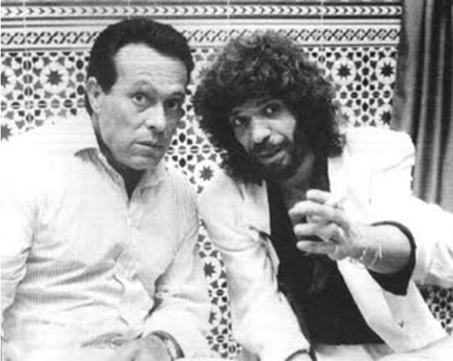
Fig. n.º 21.- Curro Romero y José Monge Cruz, Camarón de la Isla, en la Venta Vargas en San Fernando, 1991. La Fotografía se encuentra en diversos sitios de Internet. No ha sido posible identificar el autor.

H ace unos días hizo 30 años de un acontecimiento singular en el mundo de los toros y el flamenco. Fue en la plaza de toros de Badajoz, el 29 de octubre de 1988. Allí estuvimos los autores de esta breve reseña. El recuerdo, como la mayoría de las cosas de Camarón y Romero, parece más un sueño que la memoria de un hecho concreto más o menos histórico o personal: lo irreversible del arte (y de la vida), lo irreproducible, lo singular: el acontecimiento en el sentido más puro del término.