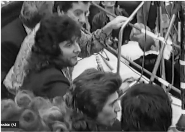
Fig. n.º 24.- Camarón y Tomatito en la plaza de toros de Badajoz el 29 de octubre de 1988. Apud. Captura imagen del video de Ricardo Pachón Flamenco Vivo , (Youtube).

Nosotros fuimos, efectivamente, como curristas y camareros –madre, hermano y hermana, y futuro marido–; unos más curristas, –nuestra madre, sobre todo–, y otros más camareros. En algún sitio veríamos el anuncio de la corrida y aprovechamos un viaje que teníamos que hacer, precisamente para preparativos