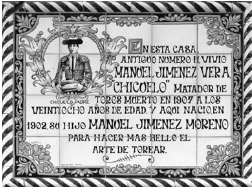
Fig. n.º 37.- El azulejo en homenaje a los Chicuelos, en la fachada del número 11 de la calle Betis (a la vera del Guadalquivir y frente a la Maestranza sevillana).

A la vista de lo leído, no resulta extraño que la musa popular sentenciara de forma inapelable: «El arte de los toros/bajó del cielo/y su mejor intérprete/fue Chicuelo ». O, dicho de otro modo, que se pueda decir que Chicuelo nació «para hacer más bello el arte de torear» 6 tal y como recoge –sin exageración alguna– el azulejo colocado en la fachada de su casa natal en la calle Betis de Sevilla (Fig. n.º 37).