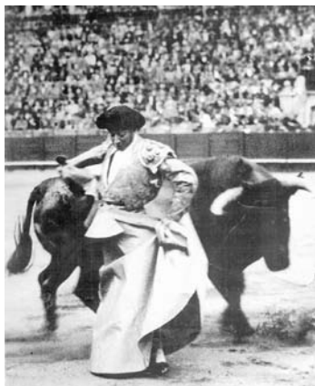
Fig. n.º 43.- La invención genial de un torero genial: La chicuelina de Chicuelo.

Creo que Alameda no tenía razón en atribuir a Belmonte una intención que el diestro de Triana no tenía. Como decía Bollaín, a Belmonte esa forma de torear ligando naturales en serie, le traía al paio ya que le era totalmente ajena. Belmonte toreaba en ochos, alternando pitones, alternando naturales y de pecho, y no en redondo. Ese era su concepto del toreo. Toreaba más cerca que los antiguos, pisando el terreno del toro con más decisión, con más temple, pero al modo y con la técnica del toreo antiguo.