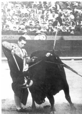
Fig. n.º 40.- Pase de la firma, a pies juntos , en Valencia la tierra de Granero el creador de ese muletazo.

muleta: «Con la derecha torea igualmente con elegancia y vistositad y su repertorio es el selecto, sin mezclar desplantes y efectismos, que por lo demás no necesita». ( Uno al Sesgo , 1922: 19). Un repertorio muletero que, además de elegante y vistoso, era extensísimo: el ayudado por alto, el pase de pecho y el de costado, el pase de costadillo, el de la firma (Fig. n.º 40), el kikiriquí , los pases de adorno... Todos con delicadeza y finura inigualables.