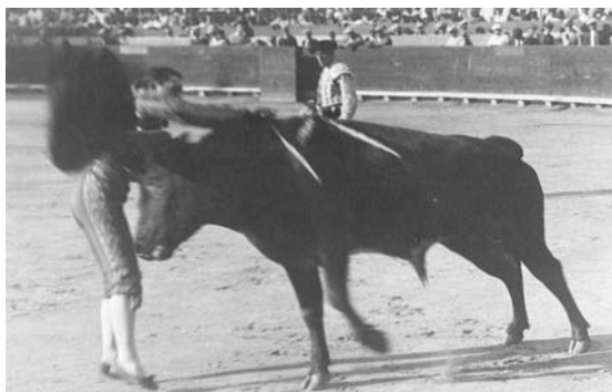
Fig. n.º 39.- Chicuelo encontraba –en su corta estatura– un hándicap para poder matar con facilidad a los toros.

Uno al Sesgo , explicaba que Chicuelo : «tiene poca habilidad para descabellar, y el ser corto de brazos aumenta la dificultad, por lo que, si los toros no están bien heridos, a veces tarda en acabar con ellos» ( Uno al Sesgo , 1922: 19) (Fig. n.º 39)