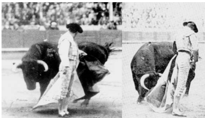
Fig. n.º 45.- A la izquierda, Chicuelo . A la derecha, Manolete . Dos toreros de diferente textura y estética, pero con el mismo concepto del toreo.

Manolete , un valiente, se inserta en la misma línea o cuerda que Chicuelo , un artista, quien, a su vez, sigue las enseñanzas de Joselito , el gran técnico 15 . De esa cuerda de toreros tan dife-