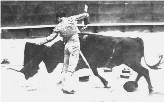
Fig. n.º 51.- México. Chicuelo immortaliza a “Dentista”. Locura colectiva de un público dispuesto a enloquecer con el buen toreo.

Pero ese honor le cupo a Chicuelo que si que pudo torear en aquellas taurinas tierras.