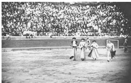
Fig. n.º 42.- Chicuelo en Bilbao se retira a la barrera tras matar al toro. Fotograma extraído de la película “Viva Madrid que es mi pueblo” (1928), producida y protagonizada por Marcial Lalanda.

decía Cossío y habremos de creerle, pero, por si no bastara, lo hemos podido comprobar con nuestros propios ojos. Me explicaré. Venimos empeñados desde hace un par de años con la familia del torero en rescatar películas de Chicuelo (Fig. n.º 42).