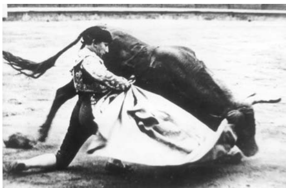
Fig. n.º 36.- Remate de media verónica de rodillas . La gracia –no exenta de técnica– del toreo sevillano.

Con Chicuelo se abre, además, un nuevo capítulo del toreo sevillano, estoy por decir que definitivo. Hay una manera especial de “decir” el toreo que podríamos identificar con algunos de los toreros nacidos en Sevilla. Una manera que