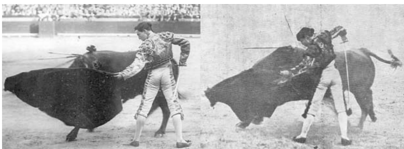
Fig. n.º 46.- A la izquierda Joselito . A la derecha, Chicuelo . Dos toreros de diferente contextura y estética, pero con el mismo concepto del toreo.

Belmonte pertenece, por el contrario, a una cuerda muy diferente, la del antiguo toreo en ochos, bien que llevado a un límite de perfección y temple antes desconocidos. Una línea en la que destacan Frascuero , el Espartero , Montes , Domingo Ortega 16 . Es, por su concepto arcaico del toreo –si bien con estética ya modernista– por lo que muchos de sus contemporáneos consideraban a Belmonte no un revolucionario sino un restaurador del toreo rondeño, de la verdad eterna del toreo 17 .