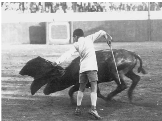
Fig. n.º 35.- Chicuelo , en el primer becerro que mató en la Huerta del Lavadero. Su artístico estilo aparece claramente definido desde el primer día.

Y, en lo que hay absoluto consenso, es en la gran capacidad artística y expresiva que atesoraba Chicuelo desde sus primeros años como becerrista en la Huerta del Lavadero (Fig. n.º 35). Por eso, nadie duda en etiquetarlo como torero de arte. Ya Uno al