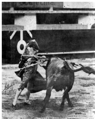
Fig. n.º 56.- Chicuelo también sabía y podía torear con el compás abierto, cargando la suerte sobre las piernas cuando le apetecía o lo necesitaba en función de las condiciones del toro, como en este natural en México.

El toreo no se cambia por revoluciones, siempre más teóricas y literarias que reales, como piensan algunos aficionados, sino por evoluciones, más ocultas y prosaicas quizás, pero más verdaderas, tal y como saben los toreros. Y en esa historia ver-