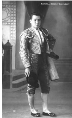
Fig. n.º 57.- Chicuelo ha sido –junto a Joselito el Gallo y a Manolete – uno de los toreros peor tratados por los tratadistas taurinos. Todos han reconocido su arte y su duende de pura estirpe sevillana, pero muy pocos han sabido ver debajo de esas formas geniales su aportación histórica a la evolución del toreo de muleta al natural en redondo. Un concepto que aprende de Joselito El Gallo y que, a su vez, transmite a Manolete .

Chicuelo es, por ello y no por su arte, su gracia o su duende, por otro parte innegables, uno de los toreros más relevantes en la historia de la fiesta. Y, en ese sentido, hay que ponerlo por encima de otros diestros que triunfaron más ruidosamente, pero cuya aportación histórica es objetivamente menor. Sin embargo, ninguneado y menospreciado por la crítica oficialista de su época, jaleado sólo como artista, es también uno de los diestros