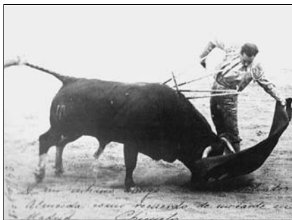
Fig. n.º 50.- Uno de los pases naturales de la faena de Chicuelo a “Corchaíto”. Un natural inmenso, entre otros muchos, en la faena más grande de la historia.

Construir una faena a base de series de naturales era algo novedoso en España. Ya hemos dicho que la faena tipo de Joselito , la que intentaban copiar los toreros de la Edad de Plata,