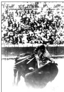
Fig. n.º 49.- Impresionante natural de Chicuelo en la Maestranza . Cuando el toro se lo permitía... Chicuelo toreaba “así” de bien (Y, un detalle técnico: Obsérvese que el toro lleva colocada la cara en la misma zona de la muleta con la que se torea en nuestros días).

era bravo y repetía, le ligaba el siguiente natural, sin cambiarle el viaje, dejando ir al toro por su terreno en línea recta (Fig. n.º 49). En un natural normal, Joselito (luego lo haría Chicuelo ) procuraba alargar el viaje del toro lo máximo posible, pero cuando el toro era noble y repetidor, el trazo del muletazo se podía curvar y acortar pues bastaba un simple giro de muñeca para presentar la muleta muerta y poder engendrar un nuevo natural ligado al anterior 29 .