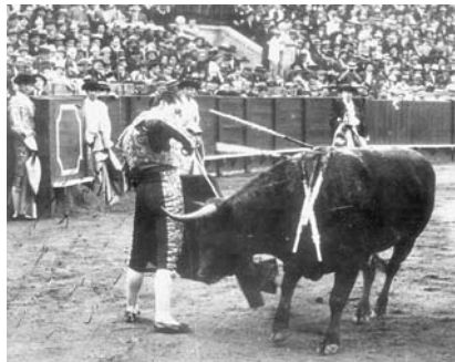
Fig. n.º 41.- Dominio y arte van de la mano en este pase ayudado a media altura de corte gallista, pero de personal estética.

extraordinario conocimiento y dominio de su profesión y de los toros. Su inspiración y su arte de filigrana, de excelsa pureza, van siempre unidos a un conocimiento perfecto del enemigo, de la situación, del momento» (Cossío, 1945: 464-465) (Fig. n.º 41). Lo