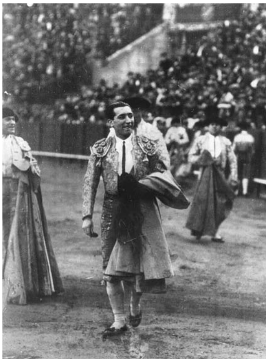
Fig. n.º 58.- Chicuelo, el gran desconocido, pasea en la Maestranza de Sevilla las dos orejas y el rabo de su oponente (1928).