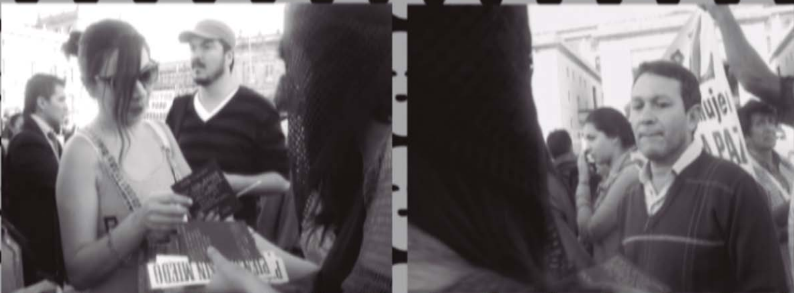
1. Extracto de pieza de video parte de la muestra Piénsese sin miedo en la Biblioteca Municipal de Chía Hoqabiga, 2014.

Este proyecto, creado en 2013, es el resultado de una investigación autobiográfica basada en la noción de víctima del conflicto armado. Es concebido como una forma de resistencia y de grito frente a los aparatos de producción hegemónicos entendidos como estructuras opresivas, rígidas y creadoras de subjetividades individualizadas que han dado origen al conflicto armado, que lo alimentan y que no dan lugar a nuevas maneras de ser, pensar, sentir y vivir.