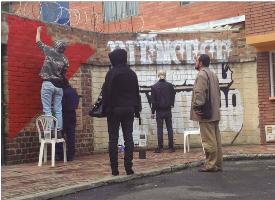
3. Mural Piénsese sin miedo realizado por CRUDO en colaboración con el proyecto, 2014.