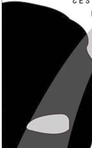
5. Pieza gráfica parte de la muestra Piénsese sin miedo en la Biblioteca Municipal de Chía Hoqabiga, 2014.