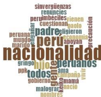
Figura 2. Significado de la palabra ciudadanía para el usuario

La codificación y procesamiento de los comentarios en el programa cualitativo NVivo arrojó que la palabra más frecuente para significar ‘ciudadanía’ fue ‘nacionalidad’, concepto que los usuarios definen en función de sus vivencias, el accionar de los actores políticos, de las instituciones y de otros peruanos (véase la figura 2).