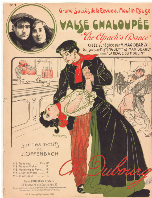
Figura 5. La danza apache.

Fuente: Tapa de la partitura de la Valse Chaloupée o danza apache. The New York Public Library – Digital Collections. Disponible en: https://digitalcollections.nypl.org/items/a9092220-bb8b-0132-74d7-58d385a7bbdo .