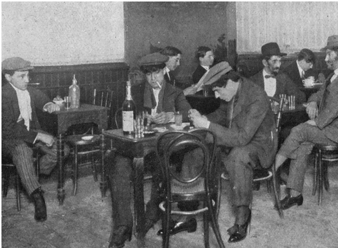
Figura 1. “Buenos Aires tenebroso: los apaches”.