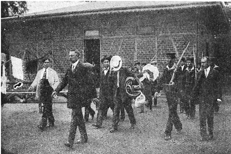
Figura 2. “Deportación de apaches”.

[100] En medio de esta campaña, Sherlock Holmes ofreció a sus lectores un agrio fotorreportaje de los apaches siendo embarcados en el puerto de Buenos Aires. El texto, de inclemente dureza con los expulsados, cuestionaba cualquier “falsa piedad social que, a título de un humanitarismo alambicado, oponga barreras de prejuicios a las justas satisfacciones de la ley coercitiva”. 22 En ese mismo tono, cada fotografía era acompañada por un comentario chacotero cargado de porteñísimo vocabulario lunfardo: “¿Qué tenés vergüenza? ¡El que se tapa la cara descubre malas intenciones!”, “Otro que le tiene tirria al objetivo, ¡pobre inocente!”, glosaba una imagen en la que el deportado se cubría el rostro para no ser captado por la cámara, mientras era escoltado por policías armados. “¡Groseros! ¡Salvajes! ¡Rastacueros! ¡Ni changador le dan a uno para que lleve la lingerie!”, se leía al pie de la foto de un deportado que cargaba sus pertenencias en una bolsa al hombro. Y así se despedía a los apaches a bordo de las lanchas que los llevarían hasta el transatlántico: “En viaje de recreo, ¡dichoso aquel que tiene su casa a flote!”, “¡Adiós, Buenos Aires, que te quedás sin gente! ¡Que seas feliz con tus taparrabos!”.