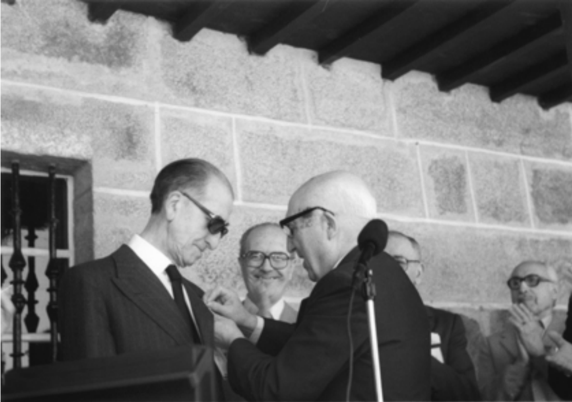
Trasalba, 19 de xuño de 1983