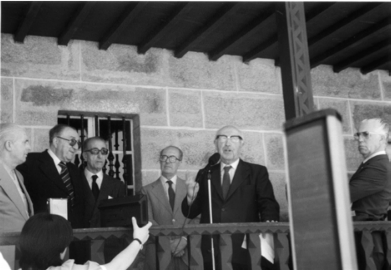
Trasalba, 19 de xuño de 1983

outros, será, entendemos, un punto importante desta relación. Desde logo que as ideas, ilusión e liberdade que aniñaba no Seminario non era posible nese momento, pero as ducias e ducias de artigos escritos por Otero e por Cuevillas nos CEG, falan dese compromiso co país por riba de todo.