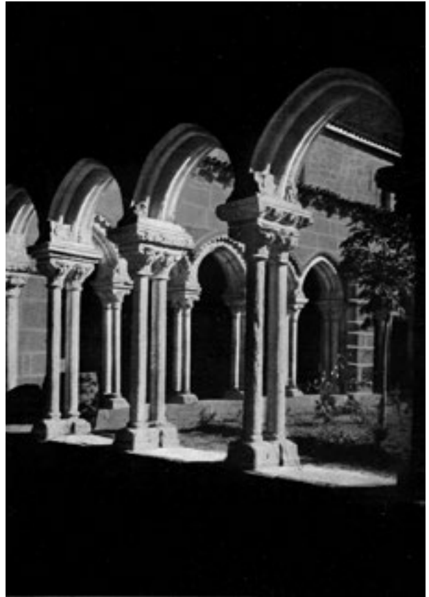
Claustro de San Francisco, por Ksado (Vida Gallega, do 20/08/1929, p. 17; Galiciana)

Fisicamente Ksado era pequeno de tamaño 21 , pero dunha grande fortaleza e resistencia. Dous dos seus sobriños foron atletas e waterpolistas na súa etapa universitaria, así que seica era cousa de familia. A meirande parte das primeiras imaxes públicas de Ksado retrátano precisamente facendo deporte. Con vinte dous anos, en 1909, formou parte do equipo fundador do “ Blanco y Negro Football Club ” de Ourense, xermolo