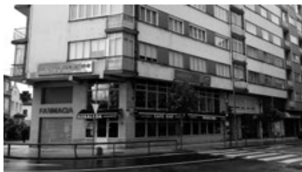
Domicilio de Ksado, no que faleceu en 1972

Ksado faleceu o 1 de febreiro de 1972 31 no seu domicilio do número 9 da rúa República Arxentina, no primeiro andar, vítima dunha « metástase canceríxena cerebral », segundo o seu parte de defunción 32 . Este anódino edificio do Ensanche hoxe forma parte desa paisaxe invisible da historia da fotografía galega, aquela que se conta virando as imaxes dos nosos fotógrafos e narrando as súas historias.