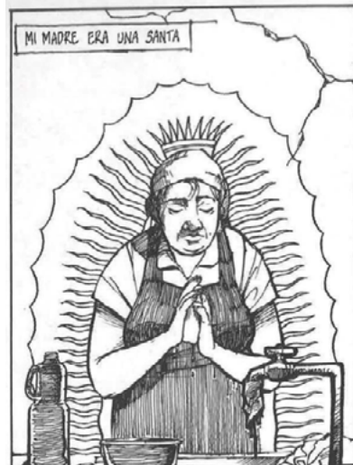
Figura 4. La madre como santa.

Usar a la virgen para acentuar el carácter de madre-posa de la mujer no es extraño; la virgen de Guadalupe representa la madre del mexicano y por ende a todas las madres de México (Traslosheros, 2002). Lo anterior se evidencia en la primera viñeta de la primera página en donde el cuadro de diálogo da inicio y reza: “mi madre era una santa”; la imagen (figura 4) que acompaña dicho diálogo es la de la madre, que en segundo plano sostiene entre sus manos una esponja; su mirada baja y las manos juntas como en una oración. En tercer plano se observa una corona en su cabeza y un halo que la rodea. El primer plano muestra el grifo de agua y los enseres de limpieza.