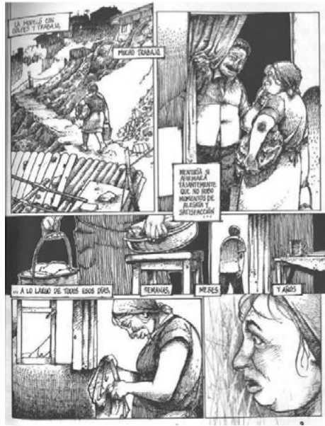
Figura 2. La representación de la pobreza.