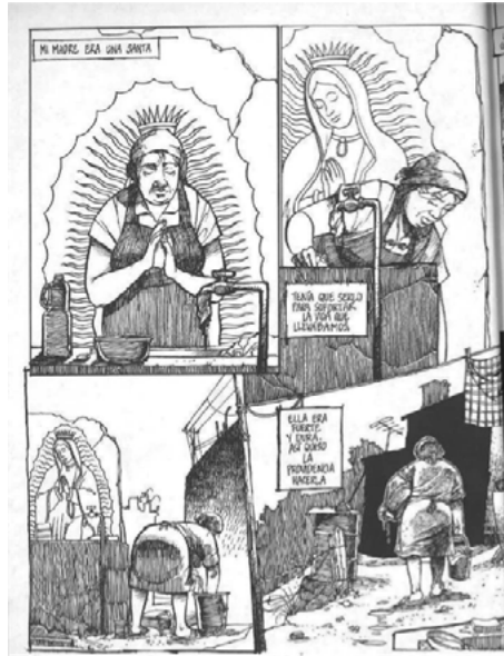
Figura 1. Entorno urbano en el que se desarrolla la historia.

para establecer claramente, e incluso exagerar, su relación con la pureza y el sacrificio.