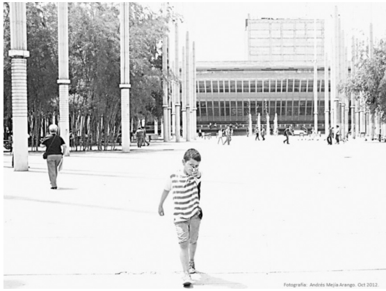
Figura 1. De la serie: Estación Cisneros y sus alrededores