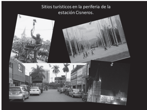
Figura 2. De la serie: Estación Cisneros y sus alrededores