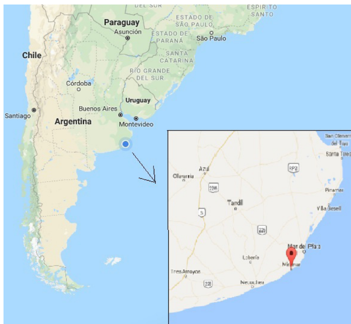
Figura 1. Mapa de ubicación de la ciudad de Miramar