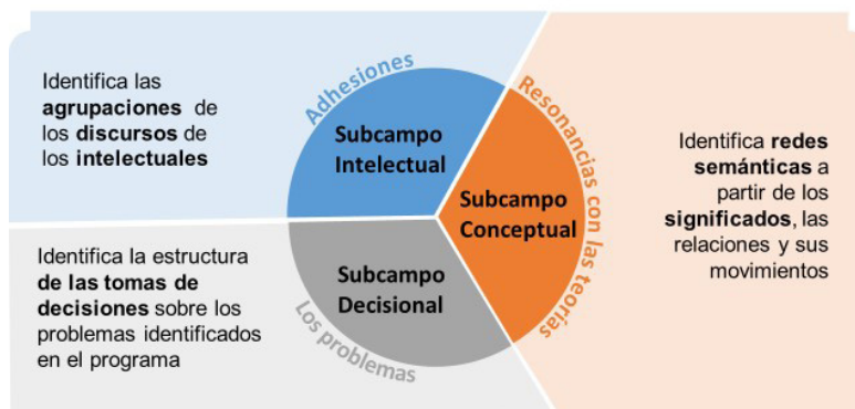
Figura 2: Esquema de la estrategia metodológica para abordar los campos: formación de profesores, currículo y didáctica de las matemáticas.