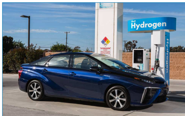
Figura 1. Estación de servicio de hidrógeno (denominada popularmente hidrogenera), junto con un vehículo eléctrico de pila de combustible y depósito de hidrógeno a presión

Se puede obtener tratando con ácidos diluidos, o incluso con agua, diversos metales (como los de los grupos 1 al 4 y lantánidos), usando electricidad mediante electrolisis del agua, mediante energía térmica usando ciclos termoquímicos, mediante energía solar directa produciendo fotólisis de agua, y mediante reformado de biomasa o combustibles fósiles. Este último método ha sido el proceso mayoritario hasta el momento, sobre todo por reformado de gas natural, aunque también se usan productos derivados del petróleo, o carbón.