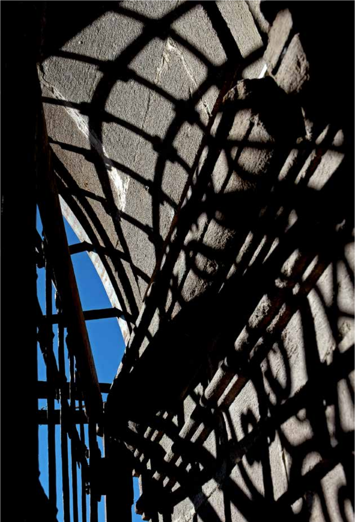
Figura 6. Raúl Yépez Collantes [YEPO]. Quito, mayo de 1999. De la serie El otro paisaje .