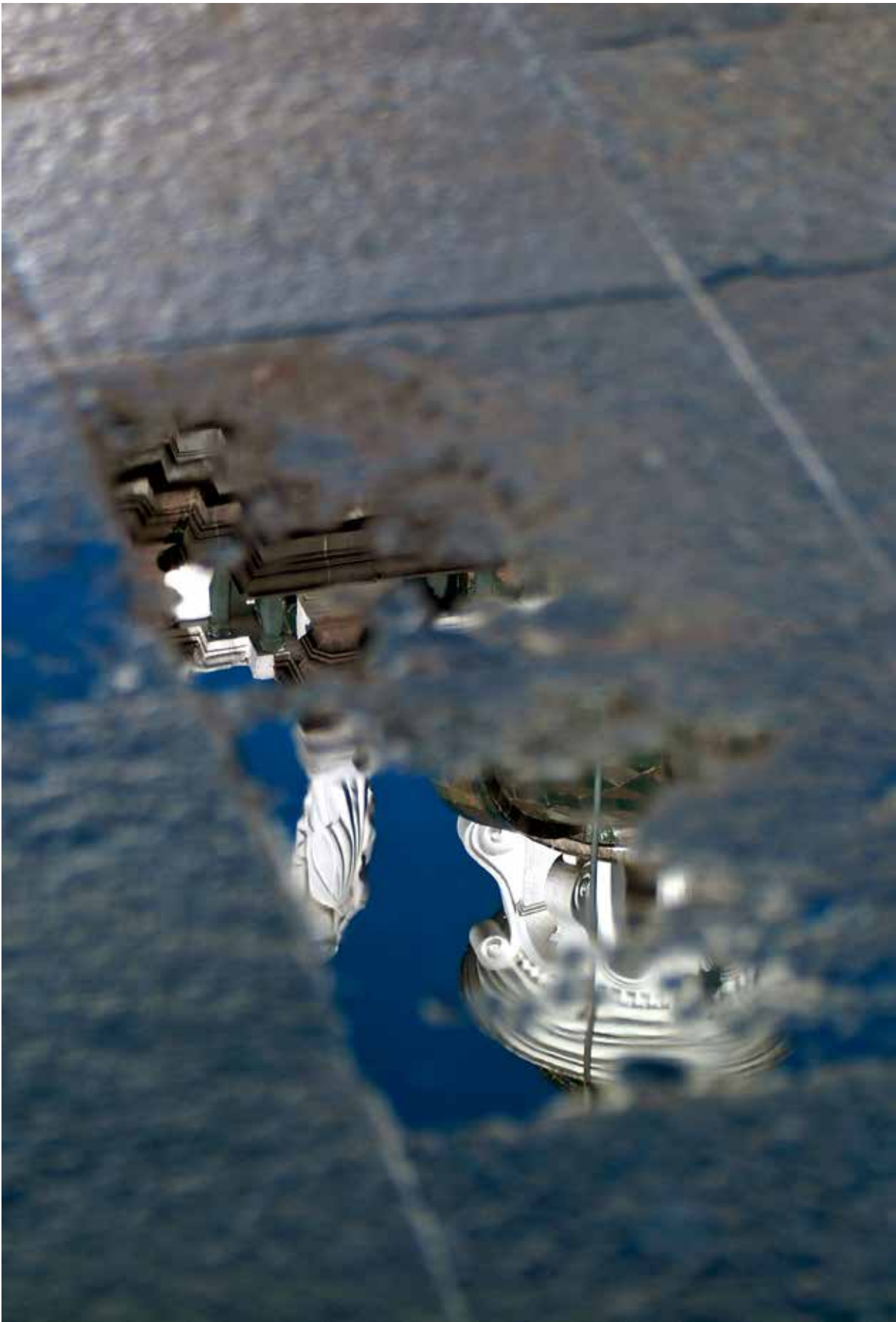
Figura 3. Raúl Yépez Collantes [YEPO]. Quito, mayo de 1999. De la serie El otro paisaje .