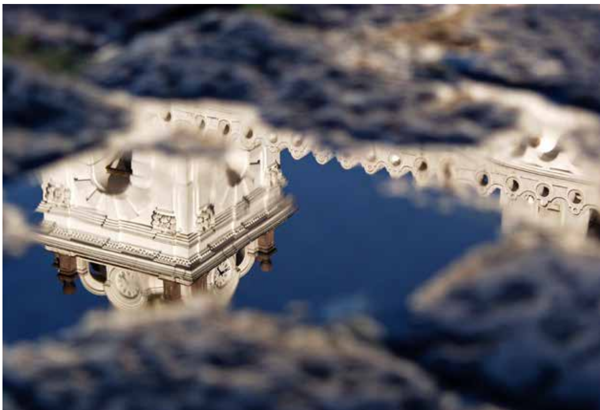
Figura 4. Raúl Yépez Collantes [YEPO]. Quito, mayo de 1999. De la serie El otro paisaje .

Puede verse en esta fotografía la gran puerta de madera de roble de 4 metros de altura, que da acceso a la Capilla de Cantuña, recinto de oración que forma parte del monumental complejo arquitectónico de San Francisco, en el Centro Histórico de Quito. Debido a la posición rasante de la luz solar, muy temprano en la mañana, se produce un efecto de sombras alargadas y organizadas bajo una doble perspectiva: una originada por sus propias proyecciones y, la otra, causada por el ángulo de toma muy cerca de la puerta. Toda la composición es una perfecta geometría de líneas perspectivas que convergen en dos puntos de fuga, uno de ellos centrado en el extremo izquierdo de la foto y el otro, del lado opuesto. El encuadre en vertical, acentúa la verticalidad de la puerta, de la columnata del portal y de las sombras que se proyectan sobre ellas, dándoles presencia y jerarquía.