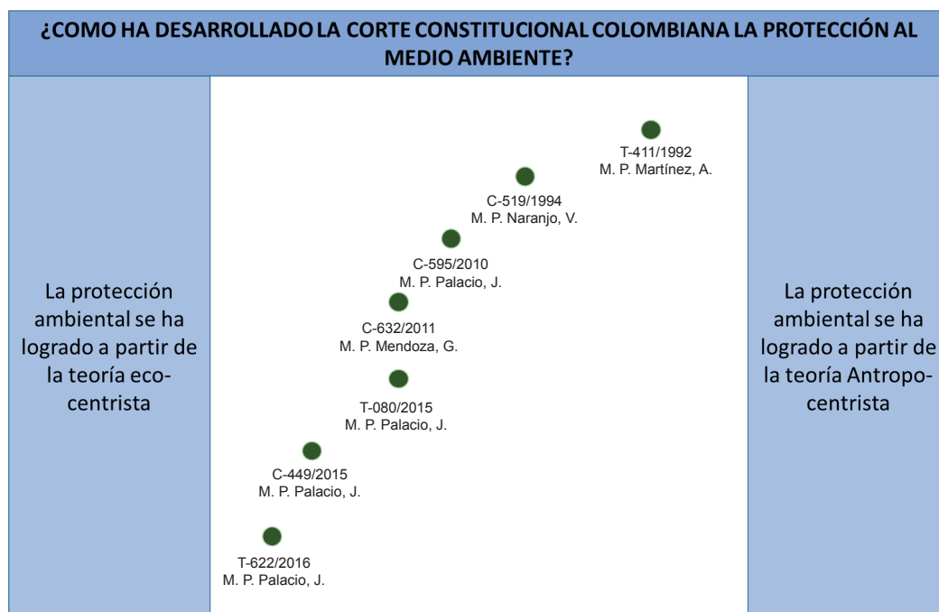
TABLA 4. LÍNEA JURISPRUDENCIAL EN MATERIA DE PROTECCIÓN AMBIENTAL

A partir de la base de este discurso entre neoconstitucionalismo y prácticas socioculturales contemporáneas en clave medioambiental fue posible que la Corte Constitucional, en Sentencia T-622 de 2016 (M. P. Jorge Iván Palacio), reconociera al río Atrato, su cuenca y afluentes, como sujeto de derechos para la protección, conservación, mantenimiento y restauración, a cargo del Estado y de las comunidades étnicas. Tal desarrollo jurisprudencial se observa en la tabla 4.