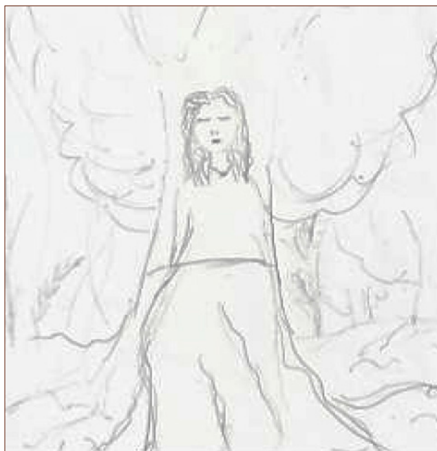
Figura 6: Dibujo identitario realizado por E7.