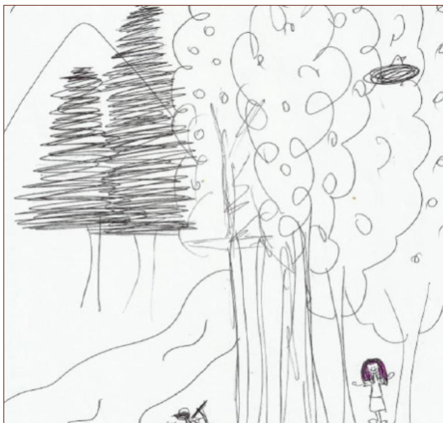
Figura 3: Dibujo identitario realizado por E11.

Las respuestas dadas por grupos de docentes en formación dejan entre ver que, para ellos, los elementos que conforman el ecosistema son cruciales a la hora de imaginarse en uno. A esto se suma la opinión de E12 quien en su dibujo se encuentra “... mirando un lago, ... escucha a los animales que salen a cazar”. Adicionalmente menciona que está “... en un bosque de Araucarias”. Se suma a ello E9 quien admira “... las especies y todo lo que tiene un bosque nativo” (ver Figura 4).