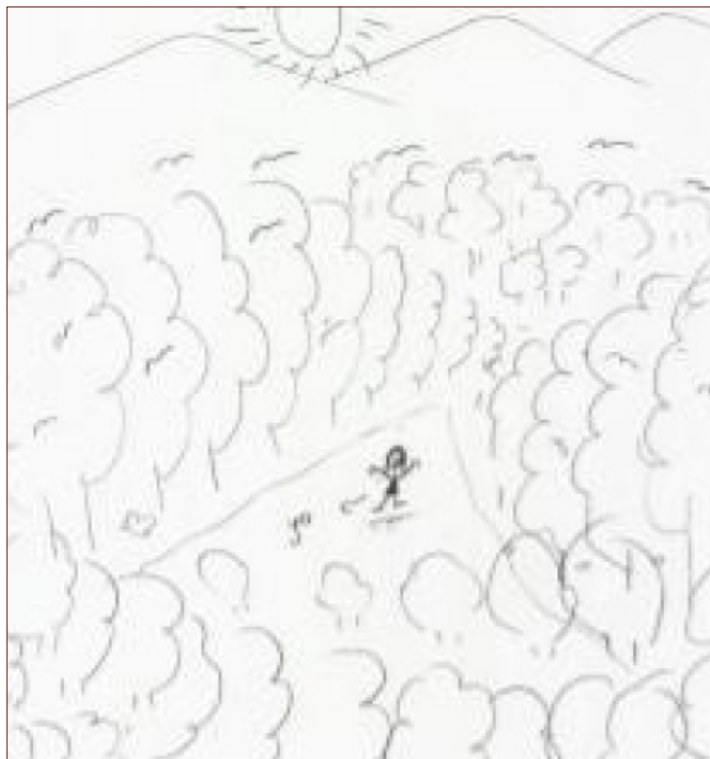
Figura 7: Dibujo identitario realizado por E8.