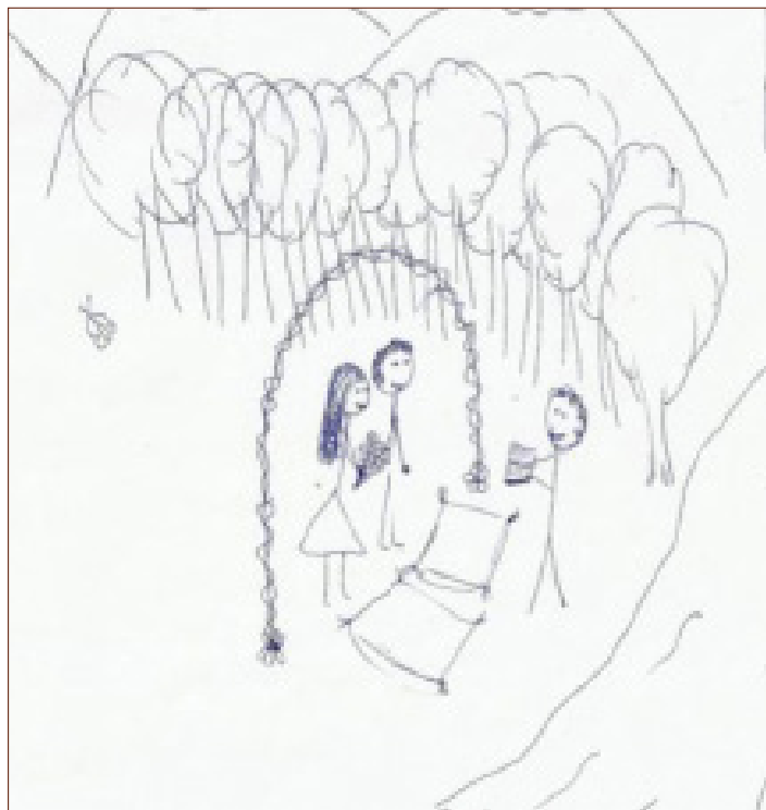
Figura 9: Dibujo identitario realizado por E14.

Las respuestas del estudiantado en formación están debidamente asociadas y arrojan que el disfrute y el estar en contacto con la naturaleza, les permite desconectarse y sobre todo lo ven como una actividad recreativa que les entrega felicidad. Al observar los dibujos asociados a las categorías de actividades recreativas, es posible identificar al individuo realizando diferentes acciones. Estas actividades favorecen a que puedan experimentar emociones y sensaciones en el ecosistema.