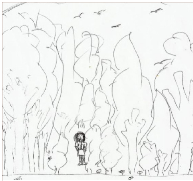
Figura 5: Dibujo identitario realizado por E1.