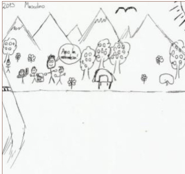
Figura 2: Dibujo identitario realizado por E6.

El personal docente en formación destaca en la explicación de los dibujos, aquellas actitudes que el ser humano debe tener dentro del bosque, a la vez, sienten al bosque como un lugar aislado y sin intervención humana. En este código, los dibujos coinciden en la presencia de árboles, animales y el sol, destacándose la forma en que cada protagonista se dibujó: con los brazos extendidos, lo que en sus relatos se expresa como sentimiento de libertad.