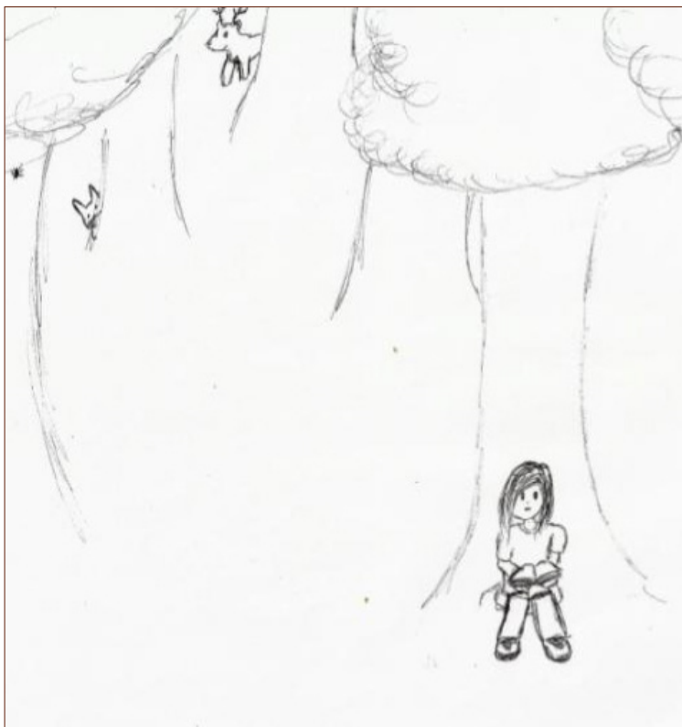
Figura 8: Dibujo identitario realizado por E15.

En momentos de ocio se puede realizar actividades recreativas, las cuales según Salazar (2008) deben ser: