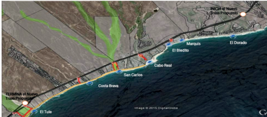
Figura 3. Playas dentro del área del proyecto Zona Dorada