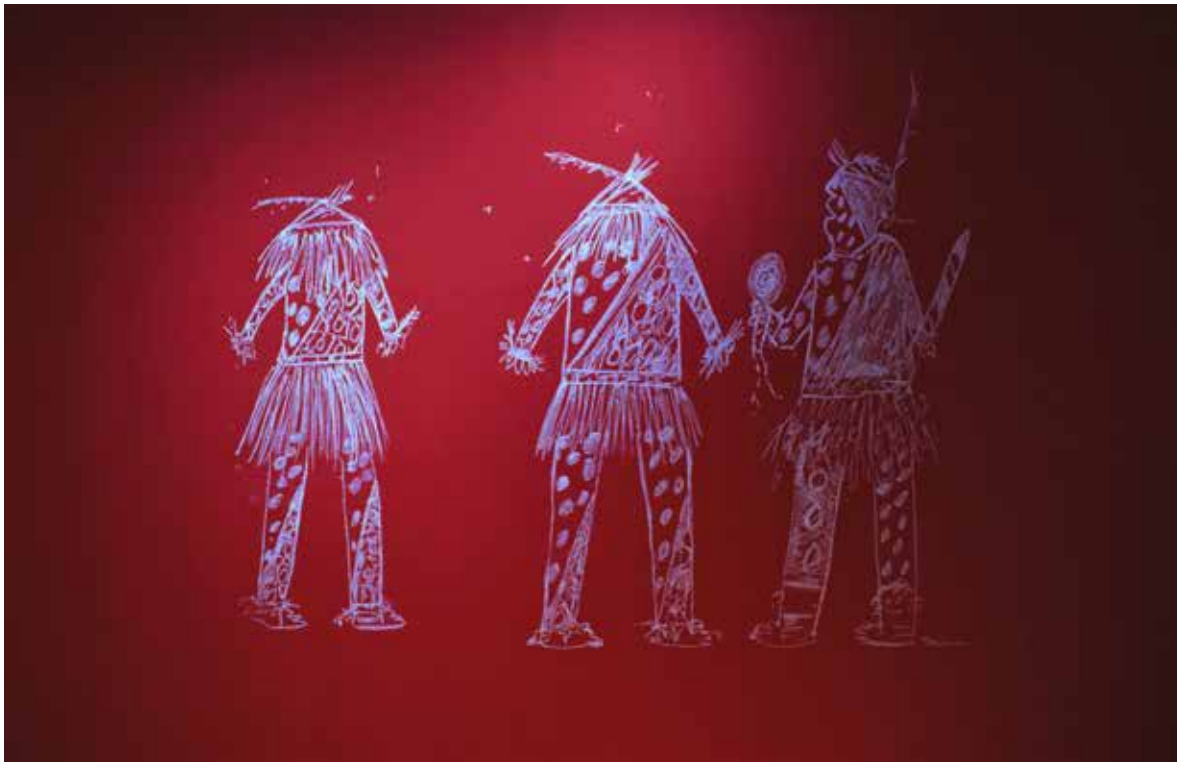
Figura 2. Reproducción de dibujo de Ogwa (artista chamacoco). Tiza sobre pared