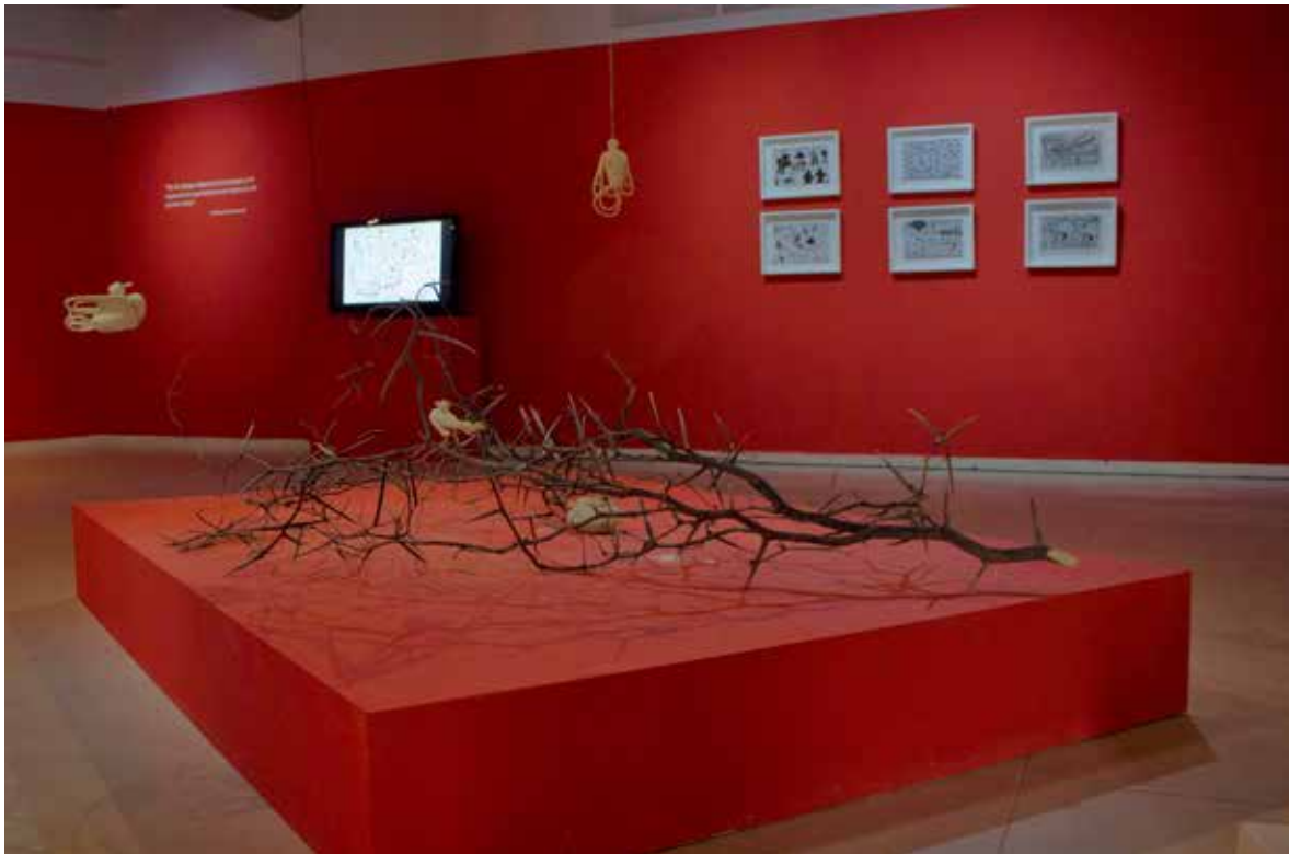
Figura 6. Raquel Arce. Instalación con ramas de espinillos y cestería pilagá