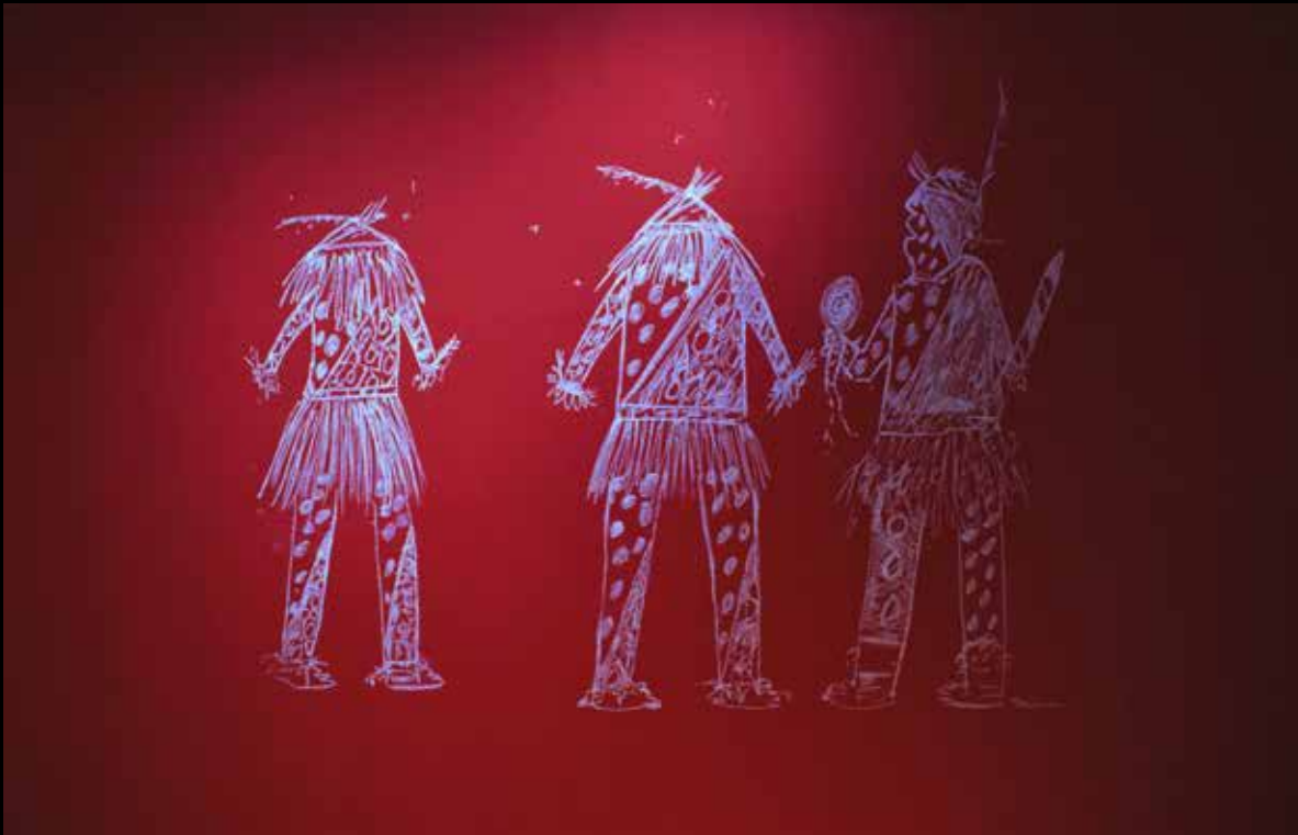
Reproducción de dibujo de Ogwa (artista chamacoco). Tiza sobre pared