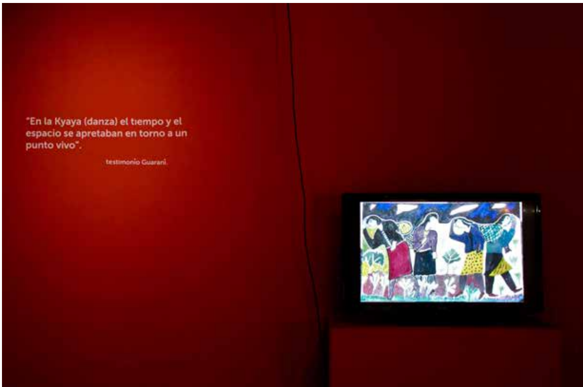
Figura 3. Testimonio Guaraní. Televisor con presentación de imágenes