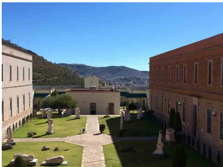
Imagen 3: Jardín de la Esculturas