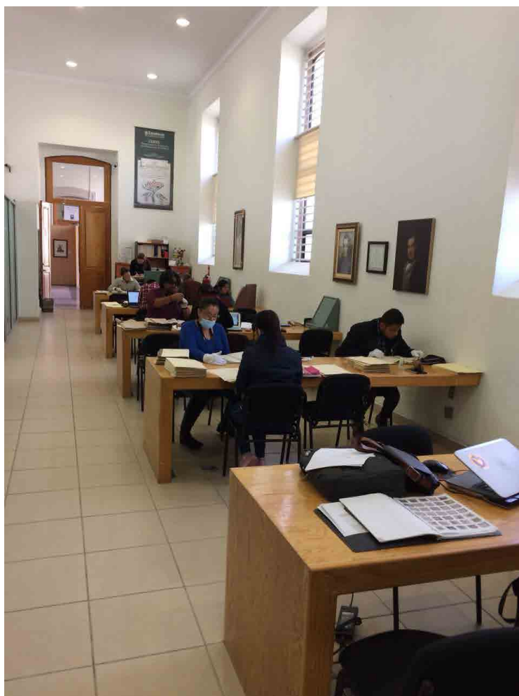
Imagen 1: Sala de Consulta del Archivo Histórico del Estado

Afortunadamente la historia de Zacatecas se revela precursora de importantes acontecimientos de la vida nacional. Por ejemplo, en el gobierno de Francisco Gracia Salinas, en 1825, impulsó el desarrollo de la minería y la educación laica y gratuita, la cual sirvió de ejemplo a Latinoamérica. En épocas recientes, nuevamente Zacatecas se destaca como pionera, en el plano nacional, al armonizar su Ley Estatal con la ley General de Archivos, la cual fue publicada apenas el 15 de junio del 2018.