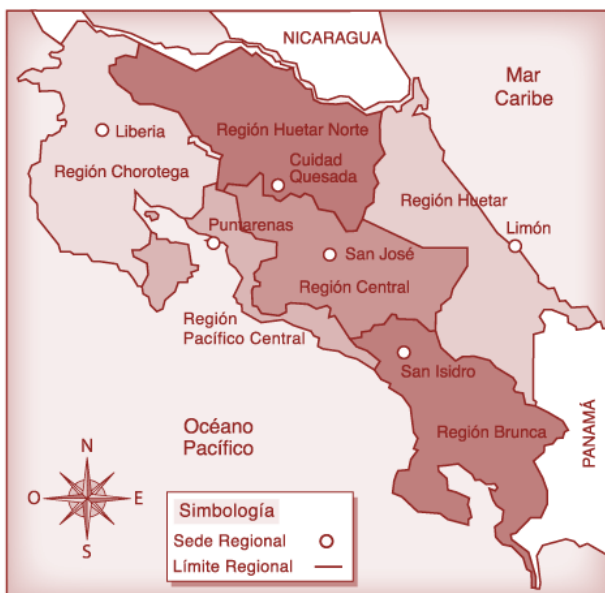
Figura 1. Mapa socioeconómico de Costa Rica. Instituto Costarricense de Educación Radiofónica, 2011.

La inequidad urbano-rural/costera puede deberse en parte a la alta centralización del Gobierno costarricense. Una reforma constitucional en 2001 estableció la transferencia del 10% del presupuesto nacional a los municipios (escalonado a 1,5% anual) acompañada de la transferencia de funciones específicas. Sin embargo, a pesar del marco legal, las limitaciones financieras han impedido la ejecución de la descentralización. Paradójicamente, mientras las enormes asimetrías en términos de la capacidad de gestión entre los municipios representan un gran reto para la descentralización, la alta centralización de la gestión pública dificulta el desarrollo y progreso de las zonas más alejadas de la meseta central.