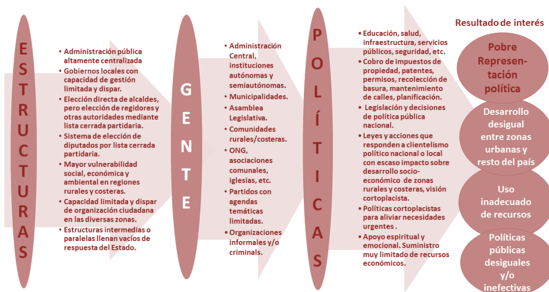
Figura 2. Embudo de causalidad.

herramienta se centra, principalmente, en lo relativo a la calidad de la representación en el congreso en el sistema proporcional por lista cerrada, y sus posibles efectos en el desarrollo socioeconómico de las zonas rurales y costeras.