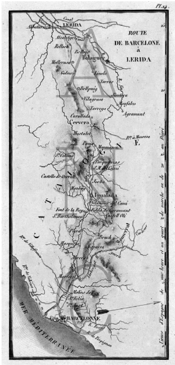
Mapa de Lartigue-Vicq (1808) que descriu la ruta entre Barcelona i Lleida. Hi consten totes les poblacions entre Bellpuig i Lleida.

Laborde cita també que a Mollerussa hi existia una casa de postes, és a dir, establiment on es realitzava la presa i canvi de cavalls per a correus, viatges o bestiar, i a més el servei de comunicacions fet amb cotxes. Les cases de postes estaven gestionades pel mestre de postes, que tenia al seu càrrec les cavalleries. A més, el francès calcula la distància entre Lleida i Mollerussa de cinc llegües. La llegua era una mesura itinerària, que variava segons els països o les localitats.