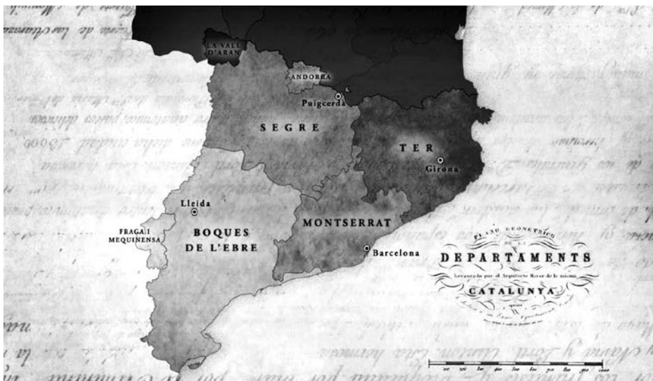
Plànol de la divisió territorial de Catalunya feta pels francesos durant la seva ocupació, que seria el pas previ per a la seva annexió a França.