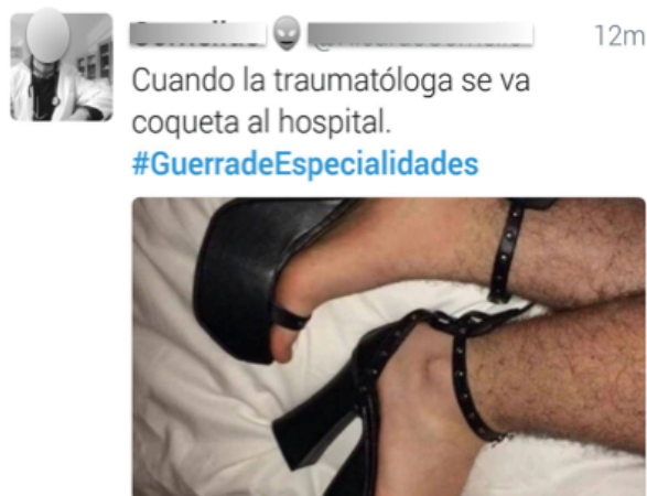
Imagen 4. Ejemplo de chiste sexista en redes sociales