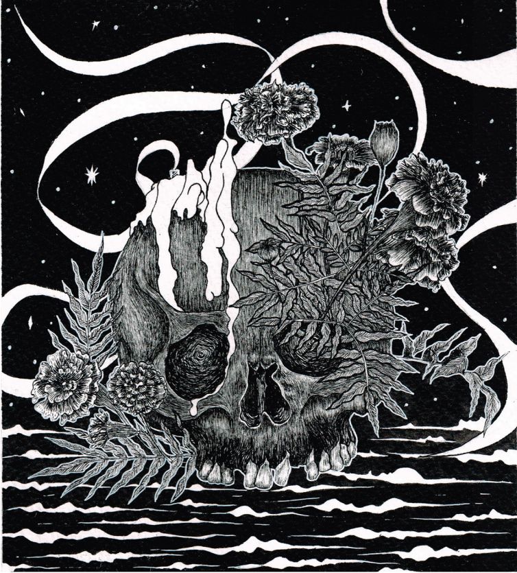
Día de los muertos (2019). Tinta china sobre papel de algodón: Larvae (Anel Martínez).

Prohibida su reproducción en obras derivadas.