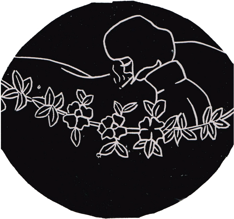
Road to tranquility (2015). Tinta china sobre papel de algodón: Larvae (Anel Martínez).

Prohibida su reproducción en obras derivadas.