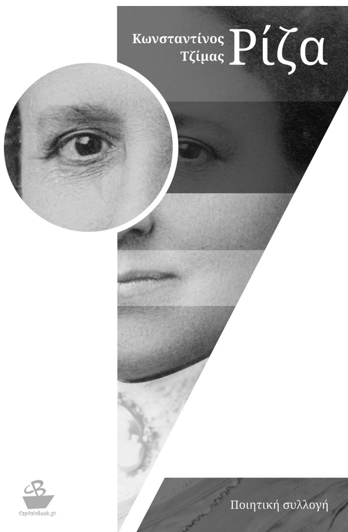
Portada de Raíz , de Constandinos Tsimas (2017).

Engendro, muero en el parto, vuelvo a mi vientre y ahí estás de nuevo.