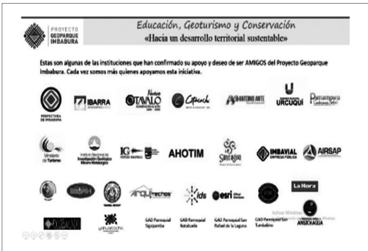
Figura 10. Logotipos de los "Amigos del Geoparque Imbabura" (Comité de Gestión Proyecto Geoparque Imbabura, 2017).

La estructura del Comité de Gestión, es una