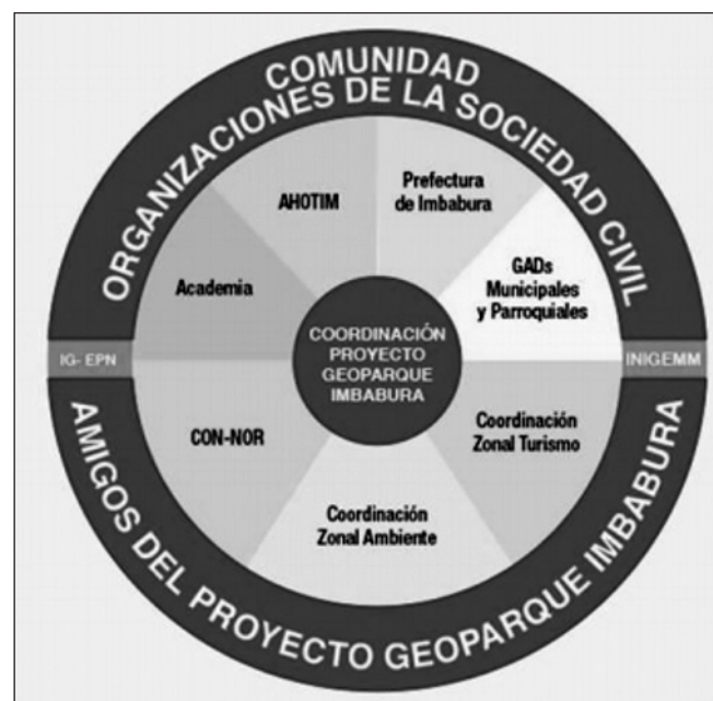
Figura 2. Esquema de articulación del Comité de Gestión y los amigos del Proyecto Geoparque Imbabura (Comité de Gestión Proyecto Geoparque Imbabura, 2017).

munitaria, poniendo en práctica la “MINGA” como valor cultural local de trabajo en equipo, en un sentido de abajo hacia arriba, socializando la propuesta en todos los ámbitos del territorio imbabureño, de tal manera que paso a paso, la población se empodere con la causa (Figura 2). Desde el año 2016, se mantiene activa la campaña “AMIGOS del Proyecto Geoparque Imbabura”, a través de la cual, se generan espacios para la socialización y reflexión respecto a la necesidad e importancia de desarrollar valores de responsabilidad social y participación activa en el proceso de desarrollo local (Comité de Gestión Proyecto Geoparque Imbabura, 2017).