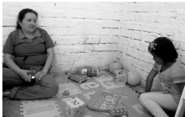
Imagen 1. Control de crecimiento y desarrollo, hipertensión arterial y planificación familiar. Zona rural de comunidad El Roble, resguardo San Lorenzo, Riosucio, Caldas, 2015

Las enfermeras también tienen en cuenta la edad, las costumbres individuales, las alteraciones fisiopatológicas y los gustos del indígena, como se observa en la imagen 1, donde la enfermera hace adaptaciones no verbales de acuerdo con las características individuales del emberá-chamí.