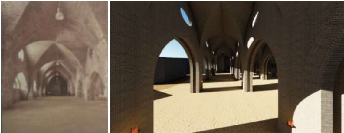
Figura 13. Reconstrucción virtual de la Nave 1