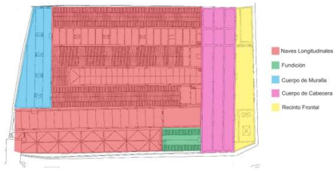
Figura 10. Ilustración de los espacios actuales