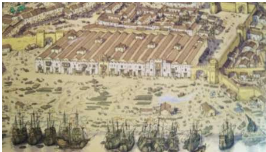
Figura 9. Dibujo Reales Atarazanas de Sevilla. Siglo XVI

Durante el siglo XVI y XVII la Corona dispondría de las naves 16 y 17 como Real Casa del Azogue y se establecería la Aduana en las naves 13, 14 y 15. El siglo XVII terminaría con la progresiva ocupación desde la nave 8 a la 12 para ubicar la Iglesia y Hospital de la Caridad.