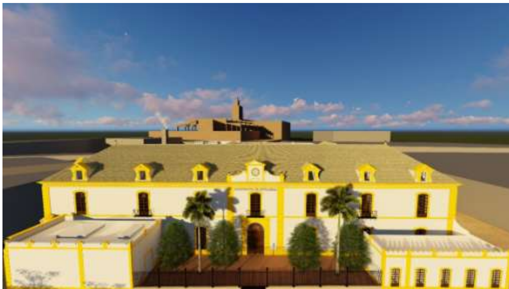
Figura 12. Reconstrucción virtual de la Fachada Principal

Finalmente, en Adobe Premiere y Adobe After Effects se monta y post-procesa la animación final añadiendo efectos e información al video, así como música que acompañe la escena.