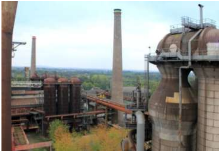
Figura 1. Parque de Duisburg - Nord. Duisburg, Alemania. Peter Latz+Partner.