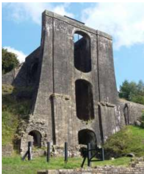
Figura 2. Paisaje industrial de Blaenavon, Reino Unido.

El paisaje industrial de Blaenavon, ubicado en el extremo este del South Wales Coalfield, presenta una gran cantidad de monumentos individuales de valor excepcional en un paisaje de gran riqueza que evoca su pasado industrial. Éste paisaje constituye una de las principales áreas del mundo donde se puede estudiar y comprender todo el proceso social, económico y tecnológico de la industrialización a través de la producción del hierro y el carbón. Su entorno paisajístico constituye uno de los mejores ejemplos que sobreviven en el mundo de un paisaje creado por la minería del carbón y la producción del hierro de finales del siglo XVIII y siglo XIX. Los testimonios de este pasado industrial son muy abundantes y adquieren un especial protagonismo (figura 2). En la actualidad la zona de Blaenavon se encuentra inscrita en la lista de los lugares del Patrimonio de la Humanidad. Son varios los recorridos industriales de carácter turístico que se pueden hacer desde el centro de visitantes, entre ellos se incluye la visita a la antigua mina Big Pit, donde se localiza el Museo de la Mina de Gales.