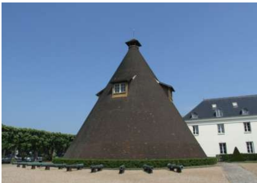
Figura 3. Ecomuseo de Le Creusot-Montceau, Francia.

En las ciudades francesas de Le Creusot y Montceau el declive de la actividad industrial como consecuencia de la reconversión de la época de postguerra dio lugar al cierre de las minas de carbón y las plantas siderúrgicas. El incremento del paro y la migración de población hicieron que se plantease la idea de recuperar los espacios industriales abandonados para crear un museo que preservara la memoria productiva de esta región de Francia. Así pues, en 1973 se crea el ecomuseo, constituyendo una experiencia única y pionera de recuperación y reutilización a gran escala de numerosos edificios de carácter industrial en un amplio territorio que abarca un área de más de 100.000 habitantes y numerosos testimonios fruto de un pasado industrial (figura 3). La sede de este ecomuseo desde donde se coordinan las distintas visitas se estableció en la vieja fábrica real de vidrios del siglo XVIII, Château de la Verrerie.