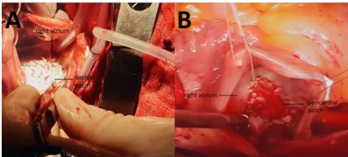
Figura 1. Imágenes de dos pacientes a quienes se les realizó cierre quirúrgico de la CIA, con empleo de parche de dacron (A) o de pericardio (B).

El análisis incluyó a 32 pacientes a quienes se les