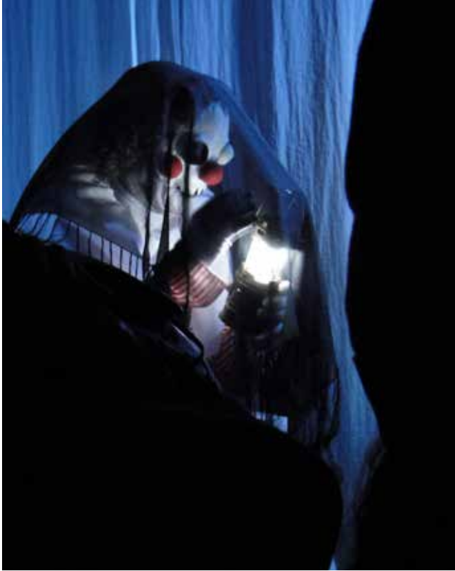
Imagen 4. El espectro que soy yo . Vendimia Teatro.

La palabra puede no ser entendida por todos los pueblos y las culturas, pero las imágenes creadas a partir de esta relación, pueden ser entendidas, vividas, disfrutadas y asimiladas por cualquier pueblo o país.