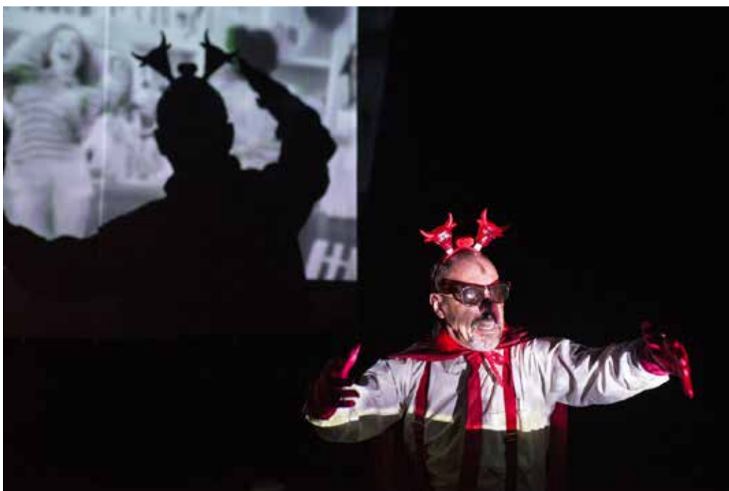
Imagen 1. El Espectro que soy yo . Vendimia Teatro.

Se hace necesario comprender el fenómeno de la liminalidad 3 y cómo es ese periodo de transición, donde es difícil apreciar el límite entre una actividad y otra, pues se generan situaciones que pueden llevar a nuevas perspectivas. Es vital entonces estudiar esos periodos donde se propician tensiones que derivan en nuevas alternativas y posibilidades para el arte escénico y para el desarrollo de la cultura y la sociedad.