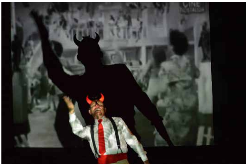
Imagen 2. El Fallecido ojo de vidrio . Vendimia Teatro.

Tradicionalmente, en el ritual siempre se utilizaron máscaras por varias razones; asumir el rol de los dioses, curar, espantar a los enemigos, defenderse de los malos espíritus, como protección e incluso como simple divertimento. Pero también la máscara jugó y juega en papel importante en la configuración de varias comunidades; se puede emplear para celebrar el triunfo, para lograr la fertilidad, para recoger las cosechas, para invocar la lluvia, es decir, para incidir en los fenómenos naturales.