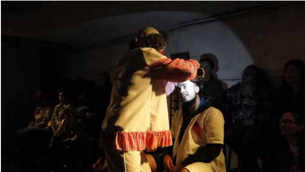
Imagen 3. El espectro que soy yo . Vendimia Teatro.

responden a esas fuerzas con la imitación, y lo hacen con su cuerpo y por medio del ritual, para intentar que lo sobrenatural entre en concordancia con lo humano. Y es por medio de la danza, de la imitación o propiamente de la re-presentación y con el empleo de tótems y objetos mágicos que se busca encarar lo misterioso, lo desconocido y lo profundo para lograr una comprensión del fenómeno natural y del lugar sagrado, adquiriendo sus poderes y compartiéndolos con la comunidad; es decir socializando la identidad sagrada y sus beneficios.