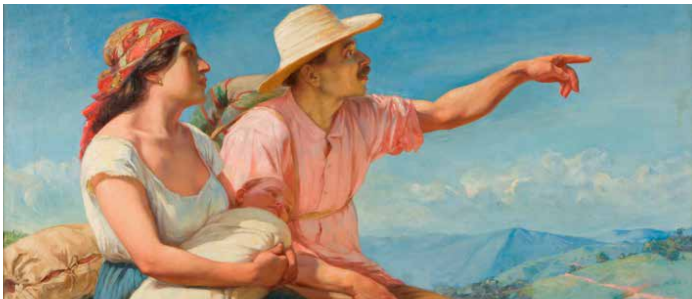
Imagen 2. Horizontes (fragmento). Óleo sobre tela, 95 x 150 cm. 1913. Autor: Francisco Antonio Cano.

La revisión de la historia de las artes en el país muestra un sin número de ejemplares de la población campesina, mestizada y de los sectores “populares” como gentes blancas. El siglo XX fue lugar de la proyección de la nación a futuro bajo las promesas de modernidad y desarrollo. Se ha logrado acoplar a los proyectos de la