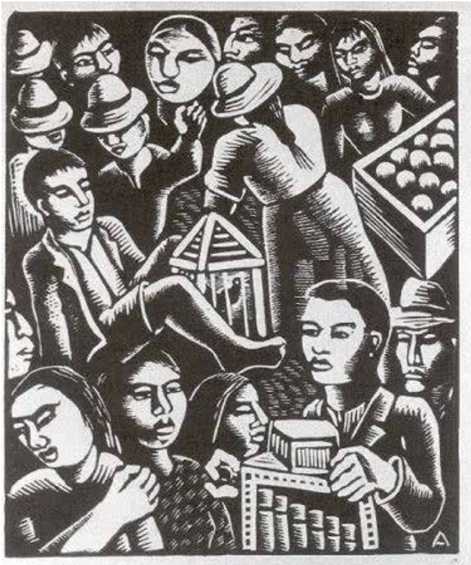
Imagen 5. Adoración del Santo Cristo de Viracachá. Carbonillo, pastel y tiza sobre tela, 120 x 80 cm. 1945. Autor: Luis Alberto Acuña.

La apertura al género indeterminable en su totalidad, la androginia presente en la imagen; o la visibilización del no mestizaje, la pervivencia de rasgos explícitamente racializados de la afrodiáspora, son elementos que suscitan la compleja corporalidad que la obra de Rodríguez constituye. Pensar que esta visibilización, o representación de realidades no contadas si se quiere, pudiera llegar a tener mayor relevancia en las artes, permite especular la presencia visual (la circulación en diversos ámbitos) de estas corporalidades como un acto performativo, y reconocer el caso opuesto de la invisibilidad como performatividad con repercusiones ópticamente políticas que instaura modos de representación hegemónicos.