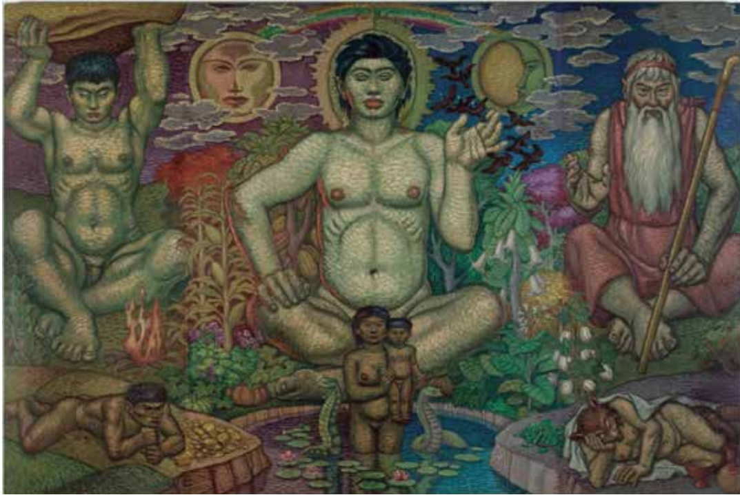
Imagen 6. Los dioses tutelares de los Chibchas. Óleo sobre madera. 200x 300 cm. 1938. Autor: Luis Alberto Acuña Colección del Museo Nacional de Colombia

el “yo” se presenta como “encarnación dentro de la naturaleza” siendo la visibilidad del cuerpo la causante del reconocimiento de la alteridad. Cuando hablamos de intersubjetividad en Merleau-Ponty, debemos referirnos más bien a intercorporalidad o coexistencia (Foschi, 2013, p. 14); pues se potencia la posibilidad de reconocer el carácter compartido de la experiencia del mundo con otras subjetividades y corporalidades, el mismo “tejido sólido” al que llamamos realidad.