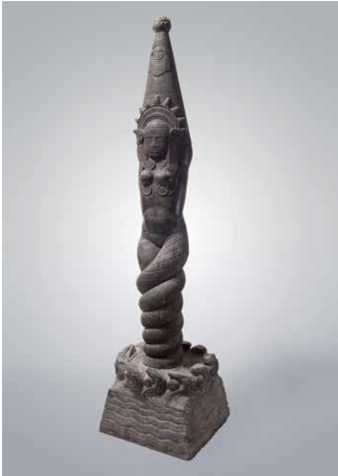
Imagen 3. Bachué. Diosa Generatriz del pueblo chibcha. Granito 1925. Autor: Rómulo Rozo. Cuaderno Bachué N.O.

nación la producción de modos de ver que son estrictamente políticos, en donde la apuesta es clara. El cuerpo popular debe apelar a ciertos estándares de belleza, pero a su vez no pasa de ser el motor físico y portador del alma, la mera fuerza de trabajo a ser sacrificada para la constitución de una nación .