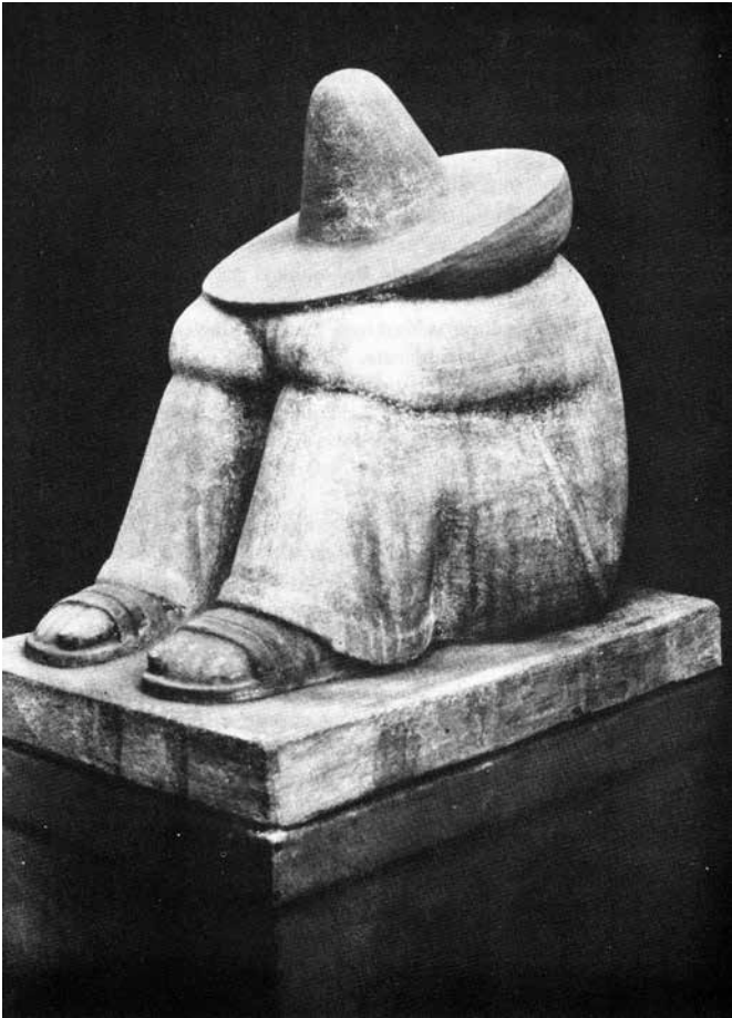
Imagen 7. El pensamiento . Madera. 1932. Autor: Rómulo Rozo. Extraído de http://www.menendezymenendez.com/search/label/FOTOGRAF%C3%8DAS%20DP

fascinación romántica por el fragmento, argumentan Lacoue-Labarthe y Nancy, parte de la premisa de que es posible la existencia de una “política ideal [...] una política orgánica” (2003, p. 151).