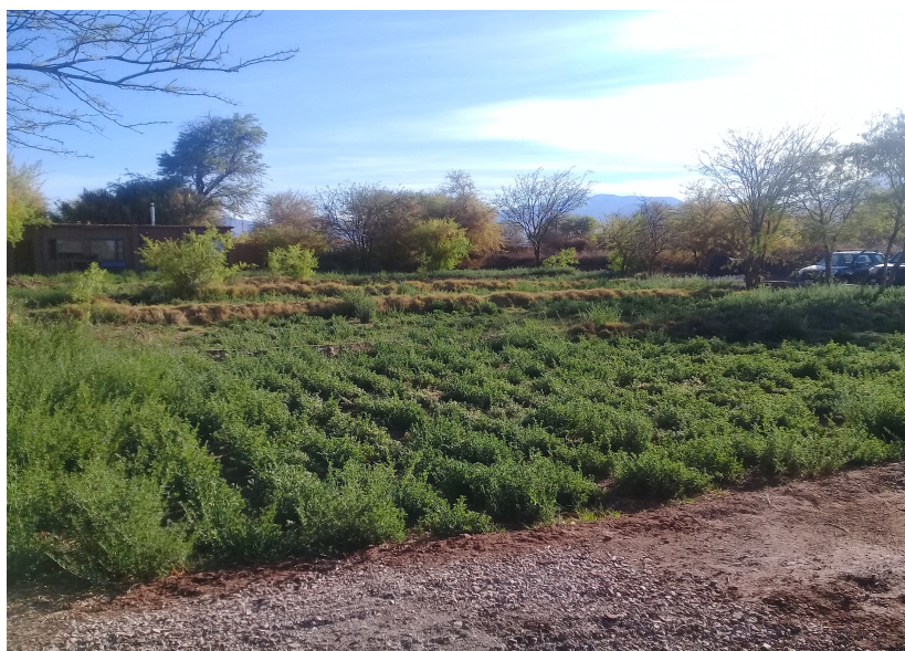
Figura 2. Cultivo de alfalfa en Solcor. Imagen testimonial de la agricultura sampedrino actual.

ayllus Sólór y Cúcuter; y sección III: ayllus Beter, Poconche, Tulor y Coyo. La subdivisión de la tierra era muy intensa –en promedio los predios tenían 1,69 hectáreas– aunque variaba entre secciones. La sección I era la más subdividida y la 3, la menos, siendo la subdivisión inversamente proporcional al acceso al riego. Sobre un total de 1.754 hectáreas, divididas en 1.035 predios con 437 propietarios, la estructura agraria presentaba una clara concentración: el grupo de propietarios de predios mayores a 5 hectáreas poseía el 60% del total de las tierras. Esto no significaba que existiese una clase terrateniente, porque el tamaño de las propiedades no estaba en relación con la riqueza de cada familia sino con el umbral de subsistencia de cada una, por debajo del cual se hubiese visto obligada a vender su fuerza de trabajo.