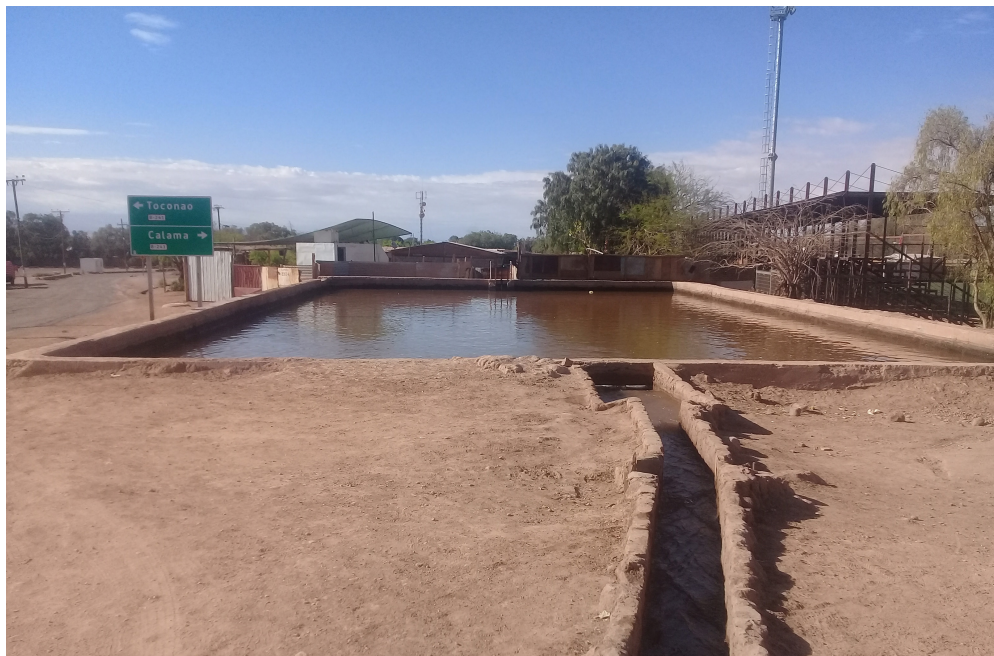
Figura 4. Reservorio de agua -ubicado a pocos metros del centro de San Pedro- que forma parte del importante sistema de regadío que surte los espacios agrícolas. Fotografía del autor

minga, consistente en contraprestaciones de trabajo comunitario. Y, a la vez, resaltó que en el presente estas mismas prácticas se combinaban con otras más modernas, como la minga con el trabajo asalariado.